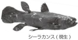
シーラカンス(現生)

「生きた化石」の代名詞・シーラカンスをはじめ、日本では数少ないカモノハシの標本も特別に展示します。