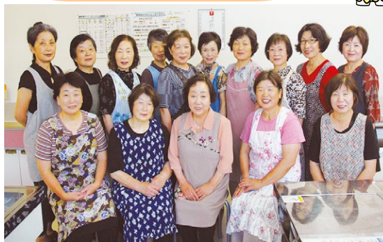
みそらの会の皆さん