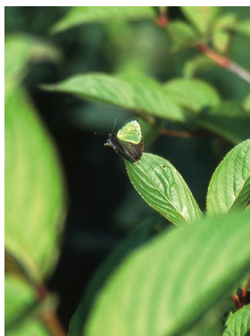
アイノミドリシジミ