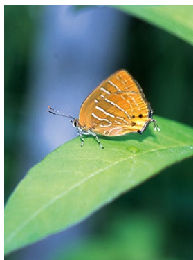
ウラミスジシジミ

那須塩原市には、120種ほどのチョウ類が生息しています。このうち、シジミチョウ科の21種類のミドリシジミ類は、ゼフィルス(「西風の精」という意)の愛称で親しまれています。 この仲間には里山の雑木林や、山地のブナ・ミズナラ林にすみ分かれています。 全ての種類が卵の状態です。