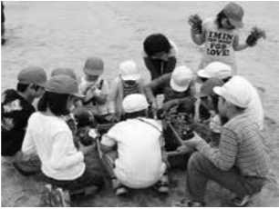
人権の花の植栽の様子(関谷小学校)