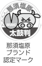
那須塩原ブランド認定マーク

対象者 市内で農林水産品や特産品を生産、加工製造している個人、企業、団体など 認定方法 認定基準(関係法令等の遵守、那須塩原らしさ・独自性・信頼性・安定性の有無)に基づき、ブランド認定審査委員会が審査します 申請方法 ☎商工観光課(☎産業観光建設課、☎産業観光建設課にある申請書に、必要書類を添付して申し込んでください) 申請期限 8月20日(月) 申し込み・問い合わせ 市農観商工連携推進協議会事務局(☎商工観光課内) ☎(62)7130