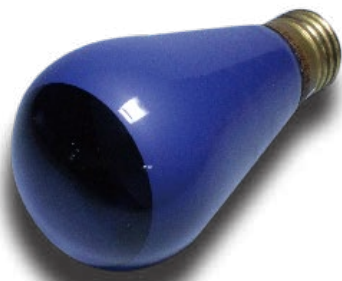
灯火管制用の電球

昭和初期、戦争は満州事変（1931年）から日中戦争を経て太平洋戦争（1941～45年）へと、15年もの長きにわたりました。その間に人びとの生活も戦時体制へと傾いていきました。