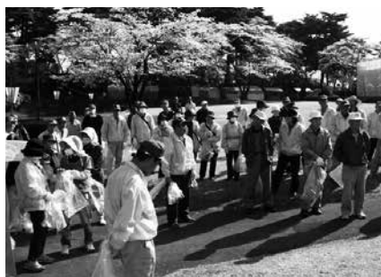
春の奉仕作業の様子