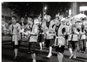
昨年(2011年)の流し踊りの様子