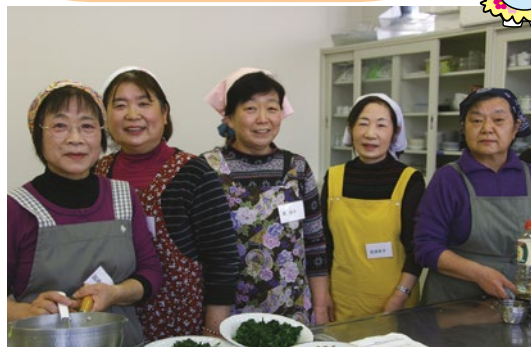
みそらの会の皆さん