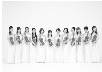
12人のヴァイオリニスト

4月8日(日)/午後2時開演/大ホール 指定席 S席3,800円(友の会3,500円) A席2,800円(友の会2,600円)