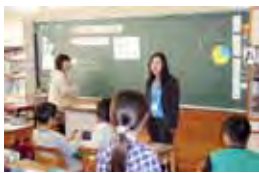
指導者2人によるきめ細やかな算数指導