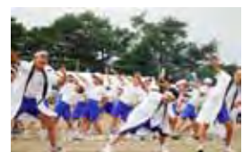
6年生を団長とした運動会の応援合戦