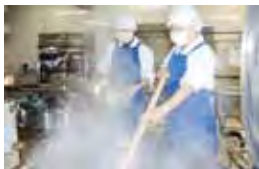
おいしくて栄養バランスのとれた温かな自校給食