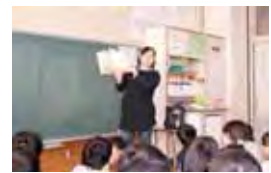
図書支援やむささびの会による朝の読み聞かせ