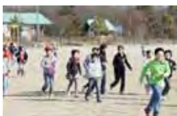
1年間を通した昼休みの体力づくり