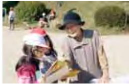
かたくりの会による四季の俳句教室