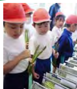
地区内のアスパラ農園での体験活動