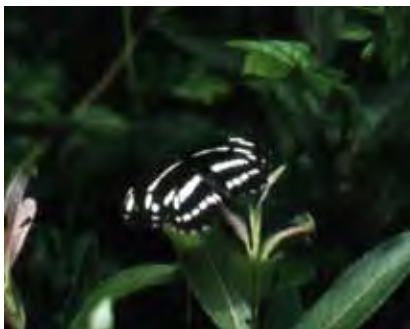
ミスジ (前翅の長さは35mm程度)

チョウのうち、タテハチョウ科の仲間には、ミスジチョウ類という一群がいます。文字通り「三筋蝶」で、翅の表裏に三本の白帯斑が走っています。 ただ、この仲間にはイチモンジチョウ(一文字蝶)、フタスジチョウ(二筋蝶)のように、白帯斑が一本や二本の種類も含まれています。 コムスジの幼虫は、フジやハギ類などマメ科各種の植物をエサにして成長します。分布はとても広く、市街地でも多数観察できます。南西諸島にはよく似た、リュウキュウミスジが分布しています。