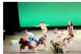
文化部(演劇)や自転車部で互いに高めあう