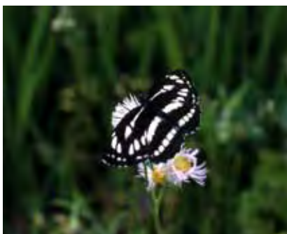
コムスジ (前翅の長さは25mm程度)

※「地産地消お料理レシピ」では、レシピを募集しています。紹介したい料理を掲載してみませんか。 問い合わせ 本秘書課