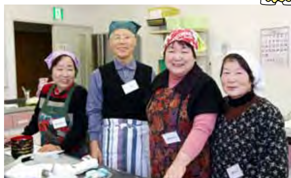
みそらの会の皆さん