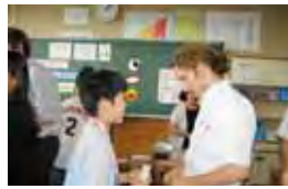
A.L.Tや英語支援教師による指導