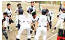
部活動で体と心を鍛える