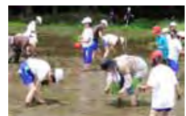
地域の人の指導で田植え品質世界第2位を獲得