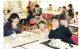
いろいろな学年とのランチルーム給食