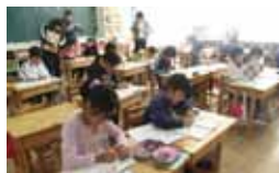
少人数学級による授業