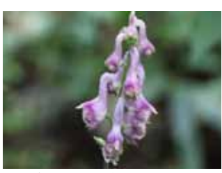
アズマレイジンソウ

冬真っ盛りの寒い日が続いています。山歩きはまだお休みです。今年は、明るい春を迎えられるといいなと願っています。 今回紹介するのは、11月に発見したキダチコンギクです。大群落を見つけました。空き地で川原にまで達しています。小さなキクの花で一つ一つ見るとそれほどこれいでもないのですが、これだけたくさん咲いていると、見事です。北米原産の帰化植物なので、埋め立て工事の土砂とともにどこから来たものと思われる。発見した時はやや終わりがけでしたので、10月中旬ぐらいが見頃かと思えます。 「アズマレイジンソウ」 キンポウゲ科トリカブト属 薄黄色のオオレイジンソウと違って、薄紫色です。 「キダチコンギク」 キク科シオン属 北アメリカ原産の多年草です。高さは1mくらいです。茎の下の方が木質化することから名前にも木立が付いたものと思われまます。白い花と桃色の花があります。 9月に北部の山林で見つけたのは、アズマレイジンソウです。まだ咲いていないのかと思いましたが、これが開花している状態だそうです。とてもきれいな花でした。