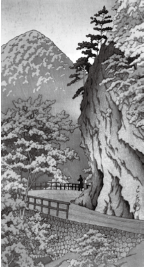
川瀬巴水《塩原猿岩》

風景へのアプローチ— あいがい 靄屋・ ゆいち 由一・ はすい 巴水— 2月12日(日)まで