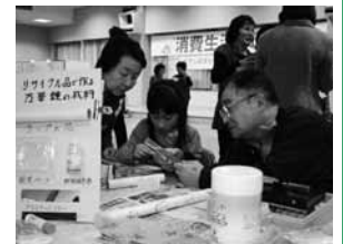
子どもに人気の工作コーナー