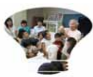
明星大学による科学教室