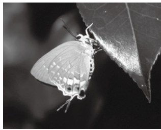
イワカワシジミ(石垣島)