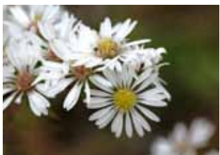
キダチコンギク (白)

※「地産地消お料理レシピ」では、レシピを募集しています。紹介したい料理を掲載してみませんか。 問い合わせ 本 秘書課