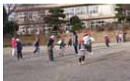
森っ子班活動（なわとび）