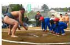
黒羽高校生を招いての相撲大会