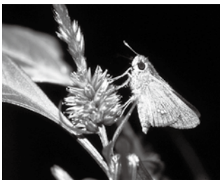
イチモンジセセリ(さくら市)