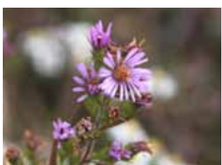
キダチコンギク (桃)