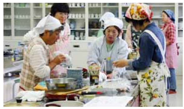
にこにこクッキングの料理実習の様子