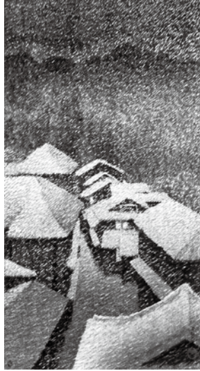
川瀬巴水《塩原畑下》