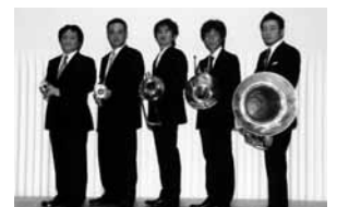
ブラス・ファンタジスタ 金管アンサンブル