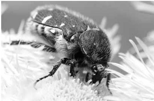
花粉を食べるコアオハナムグリ

花には蜜や花粉を求めて多くの昆虫が訪れます。花から花へと飛び回る昆虫は、植物にとっても受粉の手助けをしてくれる大切なパートナーです。