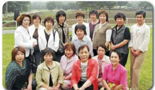
那須塩原市農村生活研究グループ協議会の皆さん

※「地産地消お料理レシピ」では、レシピを募集しています。紹介したい料理を掲載してみませんか。 問い合わせ 本 秘書課