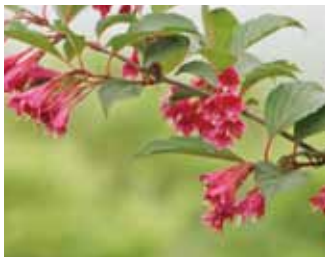
ベニバナニシキウツギ