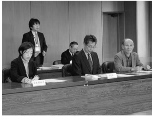
第1回モニター会議の様子

会議では、新モニターの顔 合わせと、広報誌に対する想 いや感想など、活発な意見を いただきました。