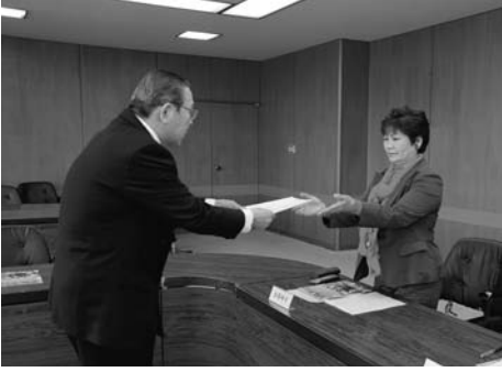
広報モニター委嘱式