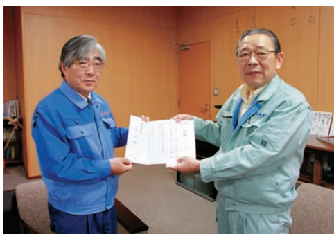
亀山市長（左）に目録を渡す栗川市長

1 床下の汚泥は床を外してから取り除きます。2 3 手やスコップで汚泥をかき出し、土のう袋に入れて、家の外へ運びます。4 汚泥は重油などを含んでいるせいか粘土のよう。しかも重い。