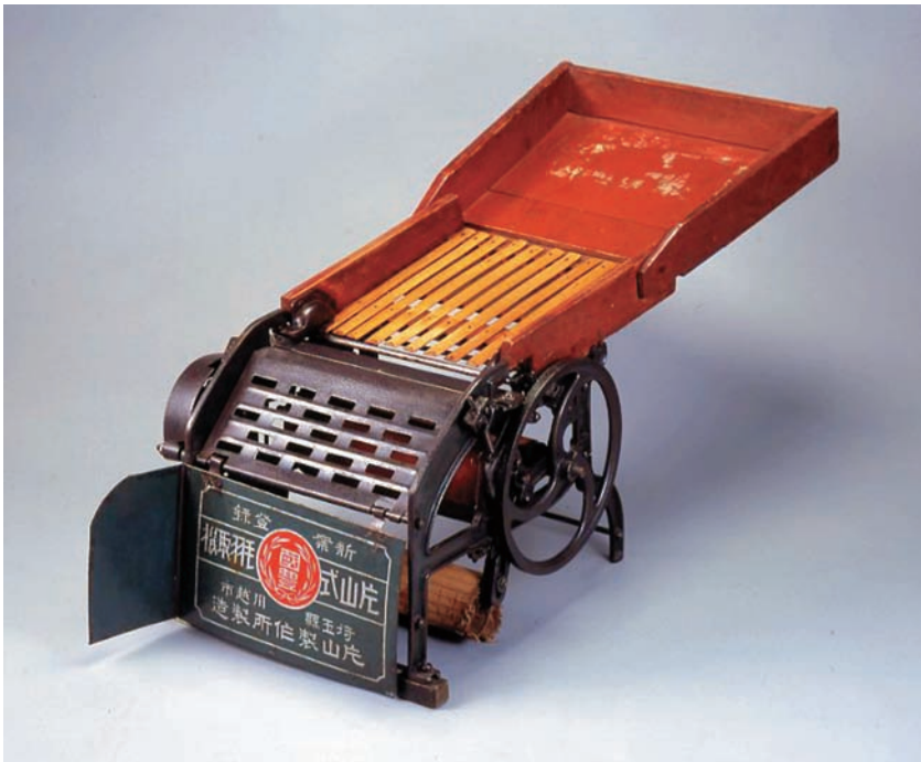
上：ケバ取り機 右：『養蚕新論』 下：蚕の卵を付けた蚕種