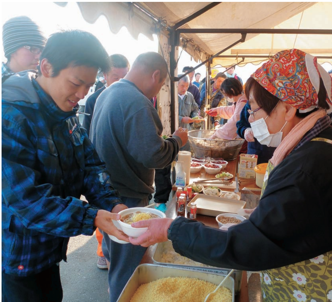
5月4・5日にボランティア連絡協議会(V連)のメンバーが石巻市で行った炊き出し。朝夕約1000食分を無料で振る舞いました。V連は5月に計3回の炊き出しを石巻市で行いました。

私は57歳まで東京で会社勤めをしていましたが、体調を崩し、娘夫婦がいる那須塩原市に引っ越ししてきました。こちらに引っ越してきても、しばらくは体調に響かないよう仕事をしたり、好きなゴルフをしたりと楽しい毎日を送っていました。しかし66歳の時に、母親を亡くしました。その時ふと「このままの人生で良いのか」と思ったのです。何かもつと人の役に立つことがしたいと思ったのです。 そして、66歳にしてはじめてボランティア活動を始めました。まずはボランティアについて学ぶため、栃木県のボランティア連絡協議会が主催した研修会に参加しました。そこで「げんごろうの会」という那珂川の水質調査やごみ拾いを行うボランティア団体のメンバーと出会いまし