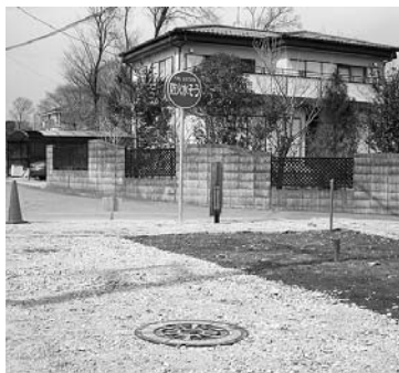
上厚崎地内の防火水槽

市では、地域の初期消火体制の充実のため、経済産業省所管の電源立地地域対策交付金を活用して、上厚崎、関谷塩原の各地内に防火水槽を設置しました。引き続き、火災予防活動に協力をお願いします。