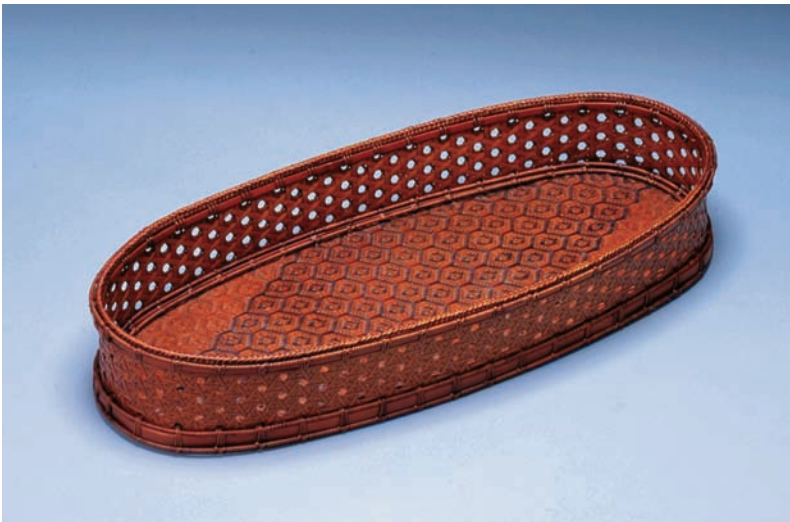
上：柳下昌峰作品《亀甲網代盛籃》