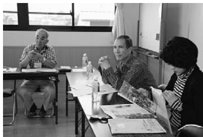
モニター会議の様子