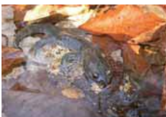
まだねむい、「山カチカ」

3月6日、ポカポカと暖かく生き物たちが動き出すという「啓蟄(けいちつ)」に、ふさわしい日でした。箒川沿いには、ネコヤナギがかわいい花を咲かせ、ヤマアカガエルも卵を産んでいました。 「もしかすると、会えるかもしれない」という気持ちから、塩原の春の使者の生息地へ車を走らせました。 使者は、トウホクサンショウウオといえます。全長、9〜14センチで、塩原に生息するクロサンショウウオ、ハコネサンショウウオの仲間です。彼らは、山の中で生活し、産卵期になると、その付近の湧水や細流の水辺に出てきます。塩原では、昔