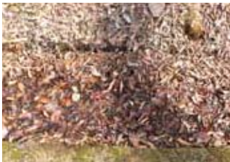
落葉で埋った産卵地