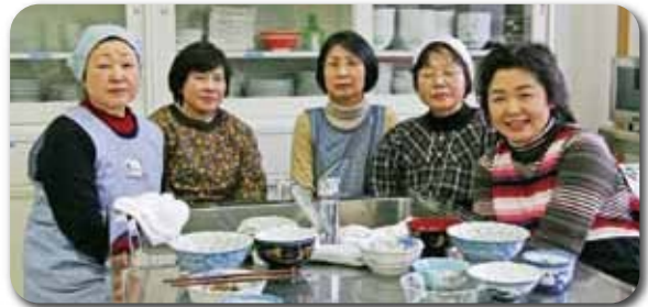
「にここッキング」の皆さん

東那須野公民館「主グループ」にて「にここッキング」協力 地元の食材を生かして楽しくクッキング