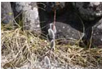
塩原では、チンコロタンコロです。

※「地産地消お料理レシピ」では、レシピを募集しています。紹介したい料理を掲載してみませんか。 問い合わせ 〓 秘書課