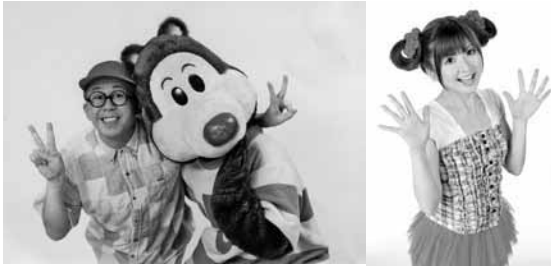
ワクワクさんとゴロリ