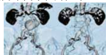
図2. 実際の症例（左術前）（右術後）