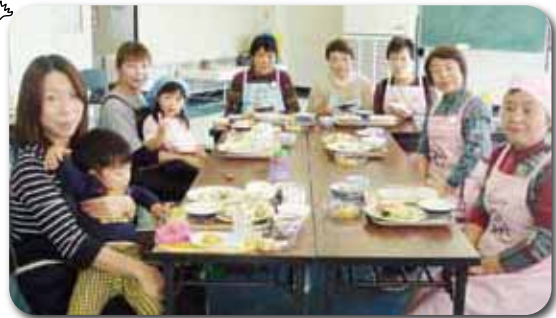
講座「牛乳・乳製品を使ったクッキングの会」参加者と食生活改善推進団体連絡協議会の皆さん

那須塩原市食生活改善推進団体連絡協議会協力 「牛乳・乳製品を使ったクッキングの会」講座