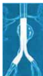
図1. ステントグラフトのイメージ

約3年前までは腹部を大切開して人工血管を移植する方法が唯一でしたが、現在では急速に普及したステントグラフト内挿術が6~7割近くを占めるようになりました。ソケイ部の小切開のみで、瘤の中に人工血管を植え込む方法です。（図1、2）手術翌日からの歩行、食事開始が可能で一週間程度の入院で済む場合も多くなってきました。低侵襲治療で、しかも従来の治療法より成績が向上した疾患として大きな注目を集めています。一方もしこの方法の適応がないと診断された場合でも、あまりがっかりすることはありません。治療成績は安定しておりますので、良く相談のうえで最終決定することが重要です。