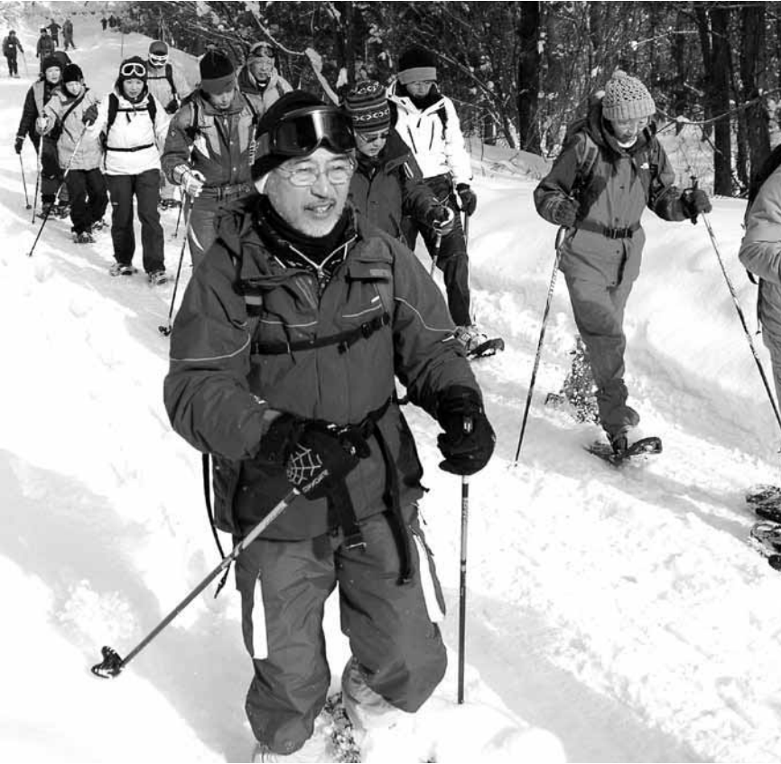
スノーシュー...雪上歩行具、西洋かんじき。