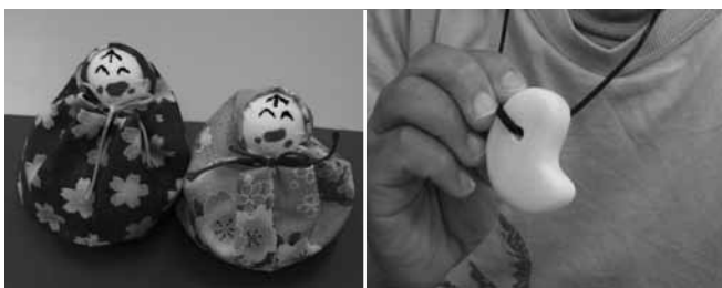
布で作ったひな人形