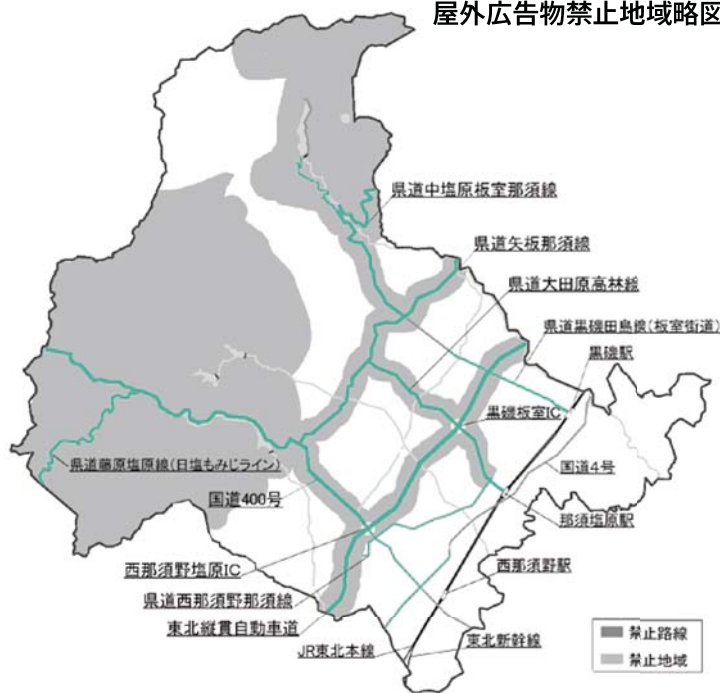
屋外広告物禁止地域略図

※上図の禁止地域以外は主に許可地域です。略図につき、詳しくは問い合わせてください。