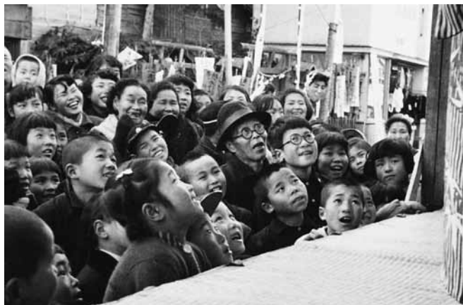
一本杉(永田町)で漫才を楽しむ人たち(昭和20年代末)