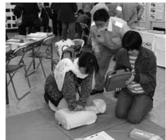
あなたの手が命を救う