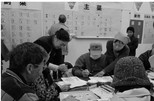
あなたの食事バランスは大丈夫？

遊んで得しちゃおう！ 身近な消費生活や環境の問題を、子どもから大人まで楽しく学べるイベントです。皆さんの来場をお待ちしています。