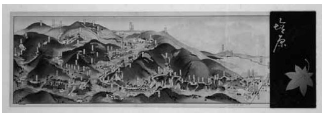
塩原温泉を紹介した図絵