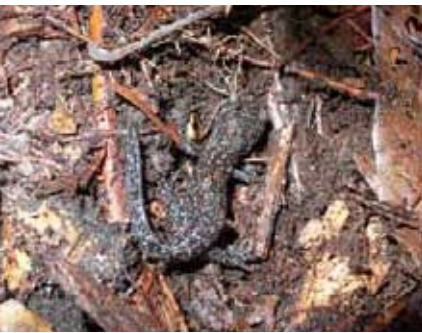
2年後また会おうネ！

※「地産地消お料理レシピ」では、レシピを募集しています。紹介したい料理を掲載してみませんか。 問い合わせ 本 秘書課