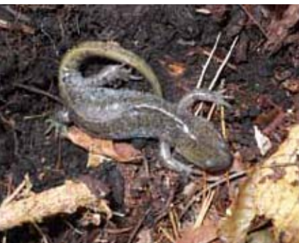
お母さんにも会えました。

新年明けまして、おめでとう ございます。今年も、塩原の生 き物たちとの出会いを求めて、 「山人」生活を送りたいと思っ ています。 話しは、去年10月中旬、木々 の葉も落ちた赤沼でのことで す。生き物たちは、やってくる 冬を向かえる準備も終わったよ うでした。水辺の静けさがそれ を教えてくれました。 そこで、その準備が整ったか どうかを見せてもらおうと、 ちよつとおせっかいはやき、倒 木の下ののぞきました。すると、 そこにいたのは、夏、上陸に初