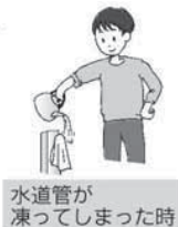
水道管が凍ってしまった時