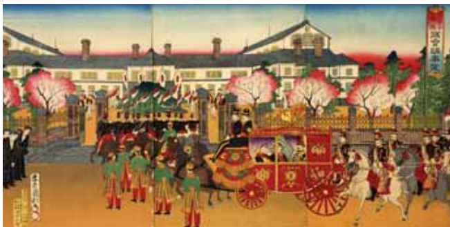
歌川国利《大日本帝国国会議事堂》