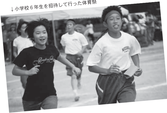
↓小学校6年生を招待して行った体育祭

校を広く知ってもらうため、各校のいろいろな行事の場面で子どもたちの活動を見てもらい、学校に対する理解や協力を頂いています。 「声かけて 地域で育てる 子どもたち」のスローガンのもと、地域を挙げて子どもたちの健全育成に取り組んでいます。