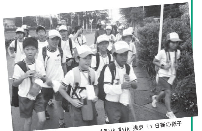
↑Walk Walk 強歩 in 日新の様子

「Walk Walk 強歩 in 日新」は日新中学校区で最も規模の大きな行事です。小学1年生から中学3年生、一般参加者を合わせ、毎年総勢1500人にもなる参加者があります。それぞれの距離を精一杯歩き、完歩を目指します。