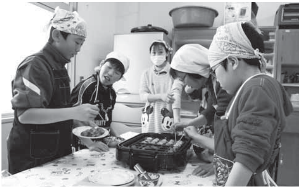
↑新入生半日体験では、たこ焼きを焼いて食べました

この事業は中学校区を一つの基盤として、児童・生徒の健やか成長を促すため、保護者、地域、公民館の皆さんに協力を頂きながらさまざまな活動を行うものです。特に、保護者や地域の皆さんに学