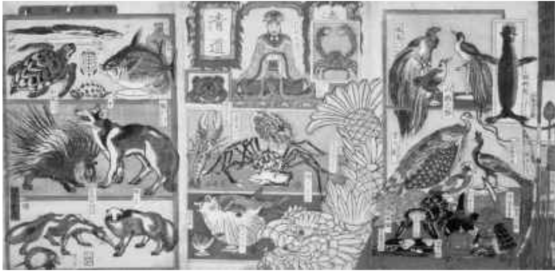
河鍋暁斎《今昔珍物集》