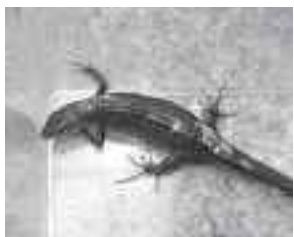
釣られちゃいました!? (カナヘビ)