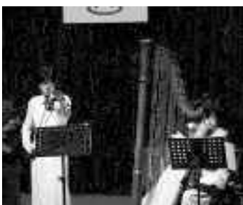
ハートフルアンサンブルによる記念演奏が行われました