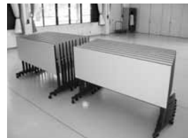
西（会議用テーブル）