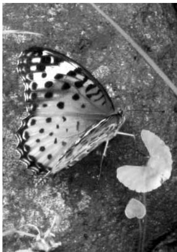
ツマグロヒョウモン(メス)

最近、地球の温暖化に伴い、本来の生息地からより北西部へ分布を広げる昆虫が話題になっていきます。県内では、モンキアゲハの分布拡大が、よく知られています。このチョウは、もともとミカン栽培の北限地で有名な、茂木町国見を北限に生息していました。ところが、1980年代から、宇都宮市などでも発生を始め、現在では那須塩原市内でも蛹で越冬できるようになりました。