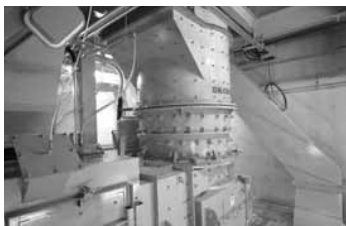
回転式破碎機 粗破碎機で破碎したごみを、より細かく破碎し選別しやすくする

回収された不燃ごみ・粗大ごみは、異物を除去された後破碎機で細かくし、磁選機で破碎アルミと破碎鉄を回収