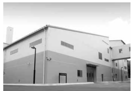
リサイクルセンター棟