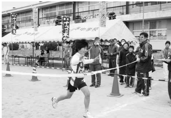
↑↓昨年11月小中合同で行われた「THE EKIDEN」の様子