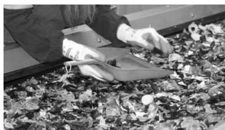
びんは手作業で、無色・茶色・その他に分別 飲料缶は磁選機でスチール・アルミ缶に分別