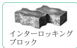
インターロッキングブロック