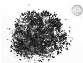
灰熔融炉で灰を1,500℃の高温で溶かし、有効利用できるスラグ(建築資材)・メタル(金属)を作る