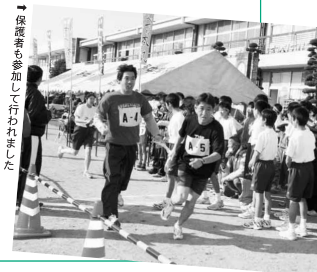
→保護者も参加して行われました