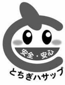
とちぎハサップ認証マーク