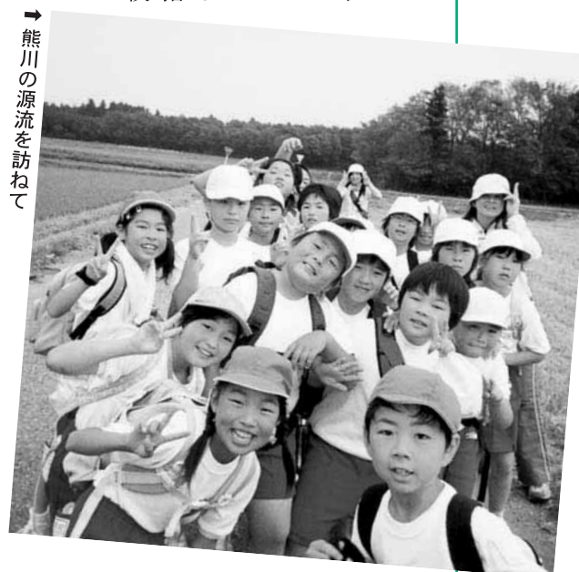
→ 熊川の源流を訪ねて

昨年度は中学校の教師からの出前授業でしたが、本年度から新たに小学校旧6年担任の先生による中