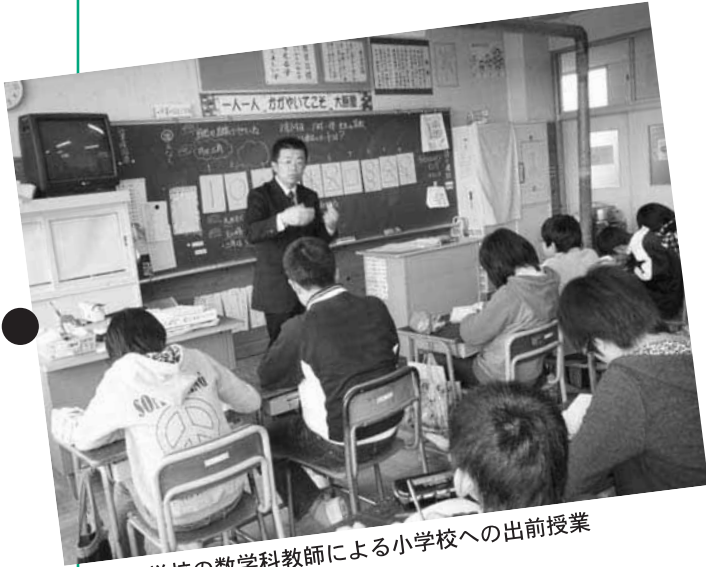
↑ 中学校の数学科教師による小学校への出前授業

那須塩原市では、小学校と中学校との連携を通して、義務教育9年間で子どもたちの人格の基盤づくりをしていく、『人づくり教育』を推進しています。 各中学校区での具体的な取り組みを、これから隔月で紹介していきます。