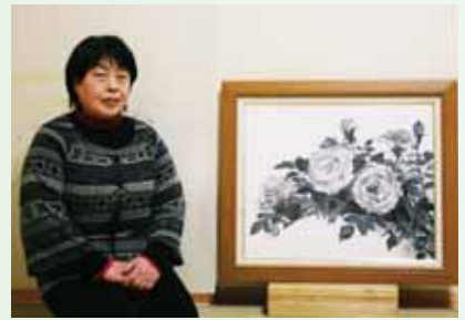
国内最大規模のアマチュア画家公募展、「第36回サロン・デ・ボザール展」(2008.11)にて墨絵『ばら』を出展し、文部科学大臣賞を受賞。 自分はどこにも所属せず、自由な立場で活動しているのが、画風に出るのではと話す。

水彩画でもなく油絵でもなく墨絵を選んだ理由は、墨と筆一本で、紙に墨を載せた時、濃淡やにじみ・かすれ・線で遠近や色までも表現する奥深さ。大好きなバラの花を墨で描いたらどうなんだろう。葉の影は？茎は？シンプルな素材から表現できることが無限にあることへの探究心からでしょうか。