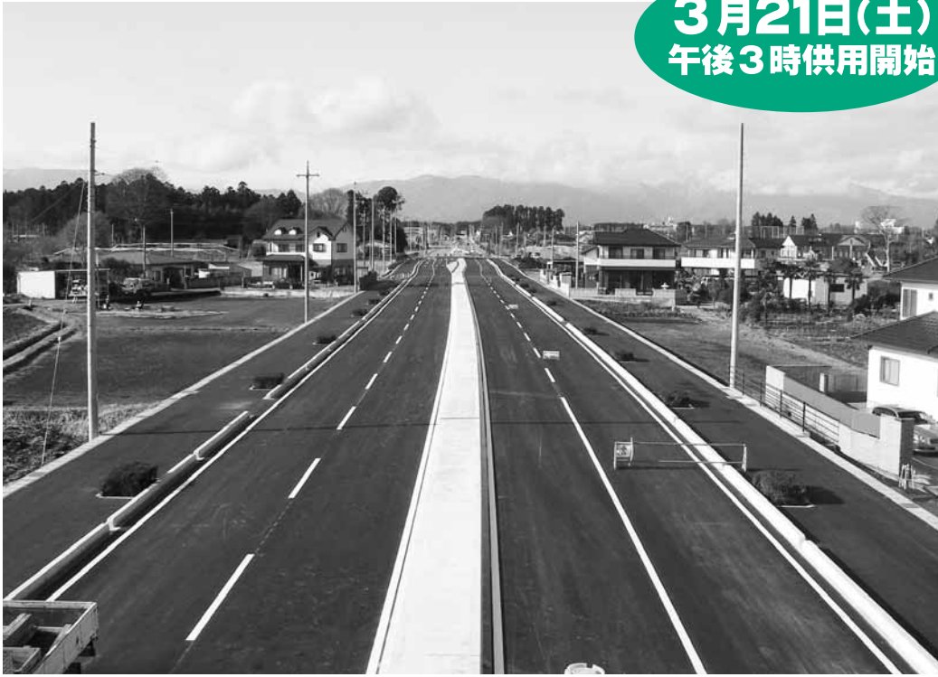
開通を待つ国道400号大田原西那須野バイパス