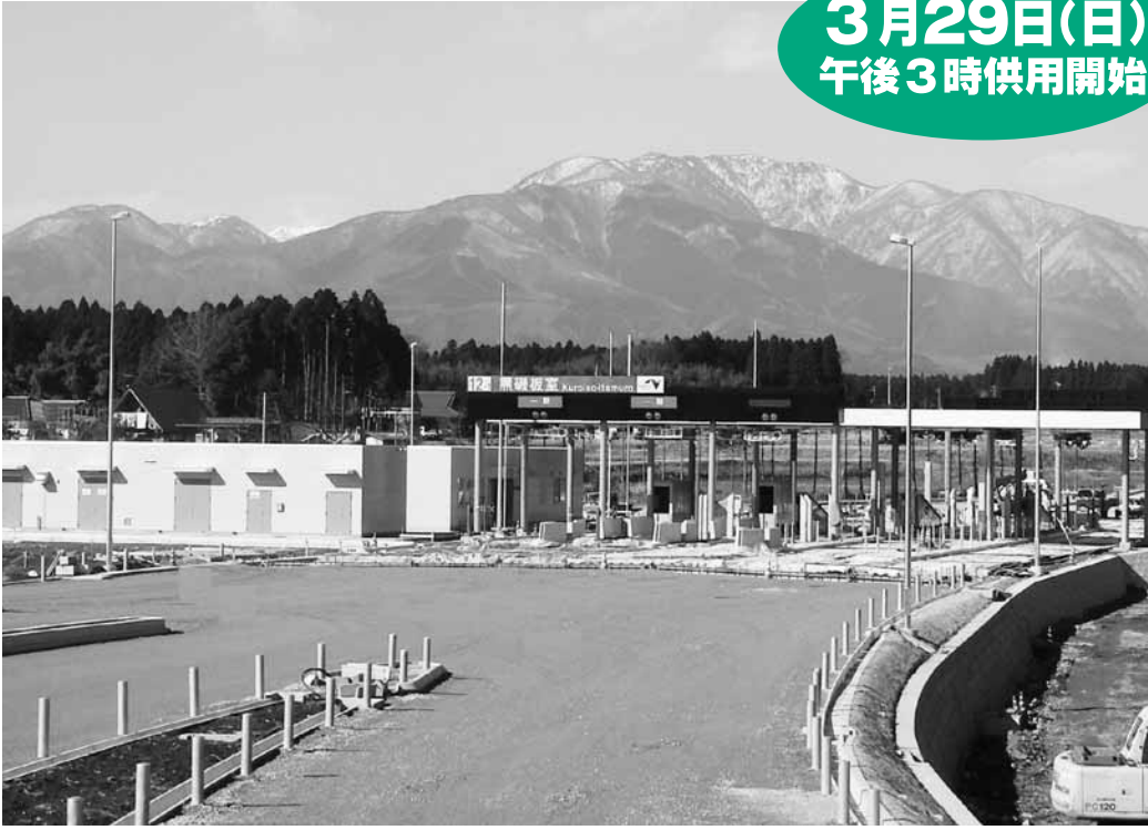
開通に向けて建設中の黒磯板室インターチェンジ