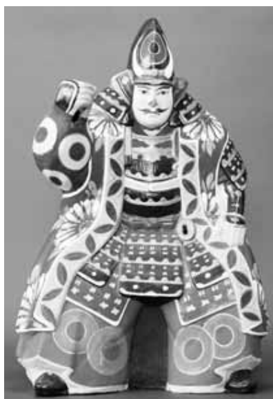
土人形 熊谷直実 熊本