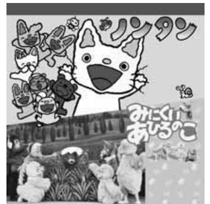
「©キヨノ サチコ / 偕成社」

3月8日(日) / 午後1時開演 全席指定 / S席2,500円 A席2,000円 B席1,500円 ※黒磯文化会館友の会会員はそれぞれ200円引き。 ※託児有り。(1歳から預かります。500円 / 1人) 公演の1週間前まで受け付けます。