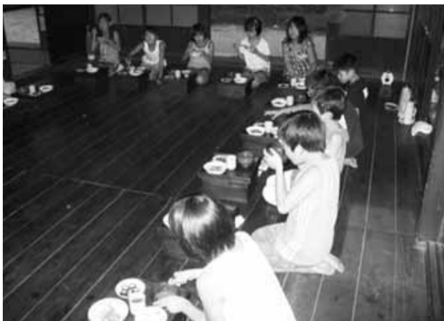
正座をして、箱膳で食事。