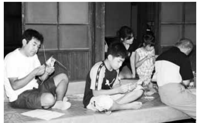
ほたるかごづくり。 お父さんと、どっちがうまく作れるかな。