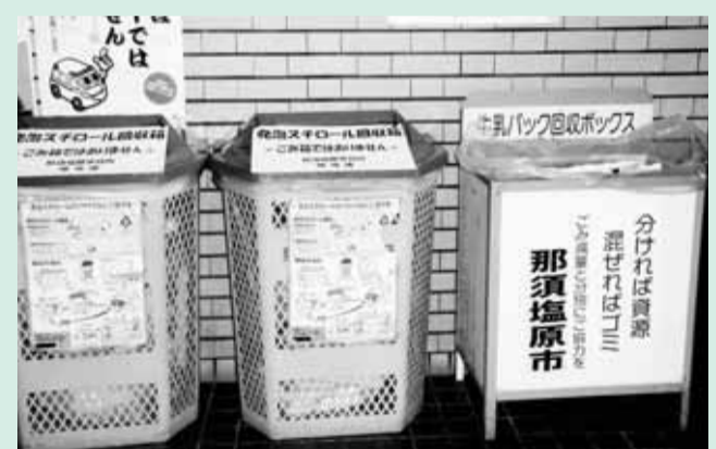
市役所に設置してある回収ボックス

ックスを設置し、回収することです。当面は、拠点回収と併せて店頭回収を積極的に利用し、分別の徹底を図っていきます。