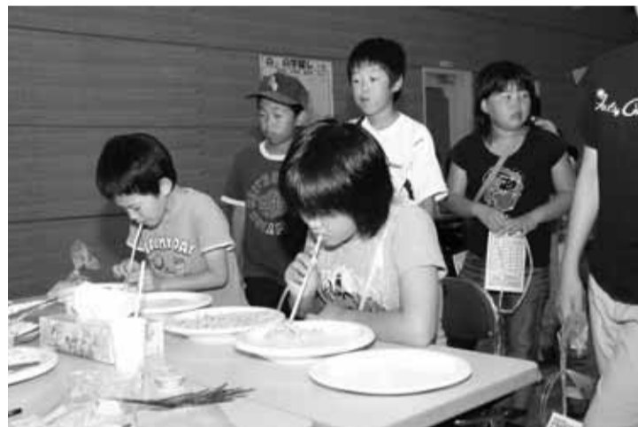
意外と難しい「すーすーえびせん」

今回は個人ゲームが8種類、団体ゲームが2種類用意され、参加した子どもたちは昨年の記録を更新しようと、みんな夢中でゲームにチャレンジしていました。