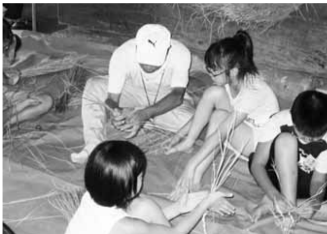
縄をよって、あしなか(かかと部分が無い草履)づくり。