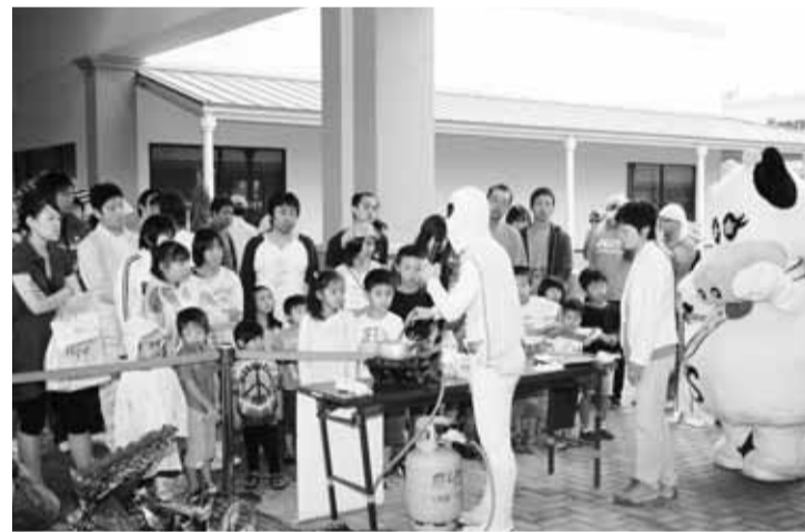
大人気、クックマンの「生キャラメル」作り。