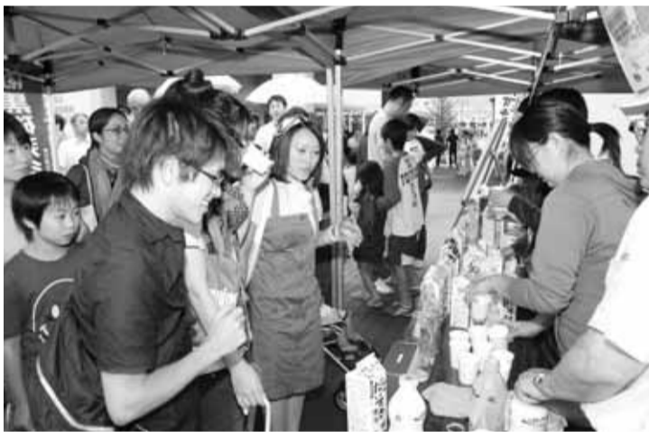
牛乳の試飲は大盛況でした。

牛乳を試飲した人たちは、「いつも飲んでいるものより濃くておいしい」「どこに行ったら買えるのか」など盛んにスタッフに話しかけていました。