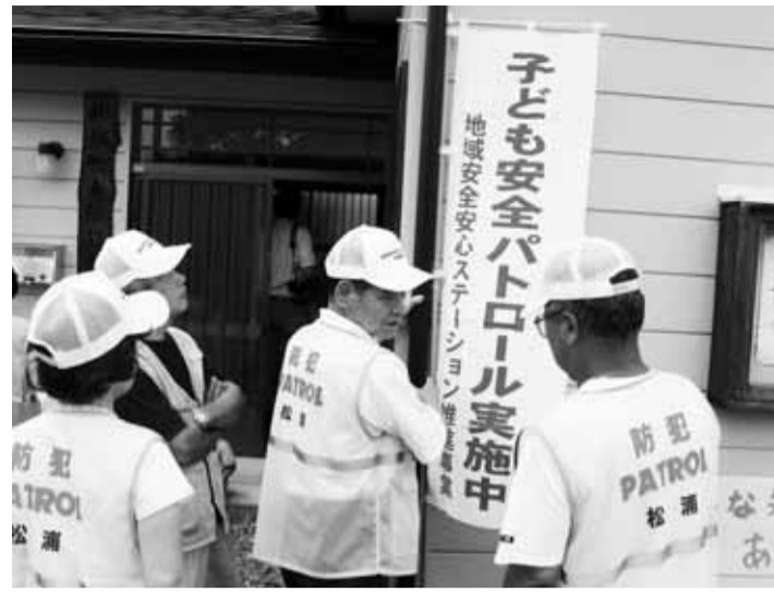
子どもたちの安全を守る松浦町の取り組み

平成17年11月の旧今市市(現日光市)における少女誘拐殺人事件の発生は、通学路を含む学校での防犯対策や地域安全のあり方について考え直すきっかけとなりました。