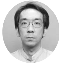
新垣 隆 (ピアノ)