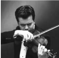
奥村智洋 (ヴァイオリン)