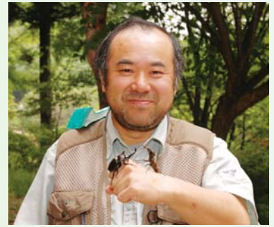
塩原の自然が大好きで、年間を通して自然環境保護の活動に取り組む。最近では世界のクワガタムシやカブトムシを飼育し、虫たちを通じて、自然や命の大切さを伝える活動をしている。

クワガタムシも他の生き物と同様に、その土地その土地で特徴がある動物で、交雑が起こらないように飼育していく責任は重いです。クワガタムシといえど、最後まで飼育する心を持って、彼らとはつきあっています。