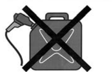
火災や爆発事故を招く恐れがあり、大変危険です。 法律で禁止されています。