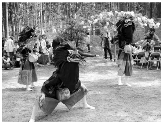
3匹の獅子頭が新しくなった木綿畑本田の獅子舞

6日：木綿畑新田の太々神楽(市指定無形民俗文化財)、 13日：穴沢の獅子舞(市指定無形民俗文化財)、 20日：高林の獅子舞(市指定無形民俗文化財)、27日：木綿畑本田の獅子舞(市指定無形民俗文化財)、 29日：百村の百堂念仏舞(国選択無形民俗文化財)、関谷の城鍬舞(県指定無形民俗文化財)