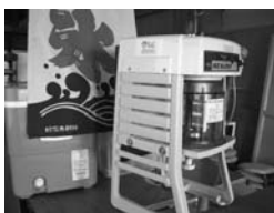
西コミュニティ:「発電機」(左)