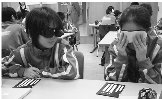
視力障害センターでの体験

親子で行っています。今後は諸活動に加え、大きな学校だからできるダイナミックな活動を、生徒と教職員