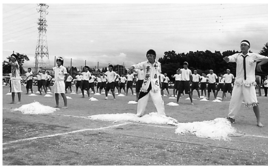
運動会での応援合戦

生徒は明るく、礼儀正しく、落ち着いた学校生活をしています。特にあいさつがよいと、地域の人々からも称賛されています。 また、学習意欲が高く、一生懸命に授業に取り組むとともに、家庭学習にも力を入れています。 さらに、部活動も大変盛んで、放課後になるとグラウンドや体育館から元気な声が聞こえてきます。練習を重ねて各種大会でたくさん賞を獲得するなど、現代版の文武両道を実践しています。 近年は「ポツポツ通りの清掃」や「地域に花を飾る活動」を