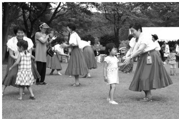
子どもたちとの交流を深めたフォークダンス

会場ではステージ発表のほか、各種模擬店での食べ物販売やバザー、点字やカヌー体験など盛りだくさんの催しが行われ、会場を訪れた人たちは交流を深めながら楽しい1日を過ごしました。