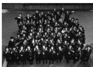
共演 西中プラスバンド部

予定曲目 シャイト：戦いのガリヤルド、スザート ：ルネッサンス舞曲集、シックリー：モーツァルト・オン・パレード ほか 共演曲目 高木登古：ブルースカイ、ギリングハム：エアロ・ダイナミクス