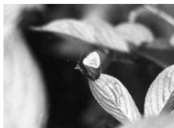
アイノミドリシジミ

シジミチヨウ科の中には、「西風の精」を意味するラテン語の Zephyrus(ゼフィルス)と総称で呼ばれ、愛好家に親しまれている華麗な一群があります。日本国内全体には二十五種が生息し、栃木県内では二十種が確認されています。そして、那須塩原市には二十種すべてが分布しており、この地域を代表するチヨウ類の一つに数えられます。これらには、多くの共通点があります。例えば、全種が樹林帯と密接な関係にあり、生息地は比較的限られる。いずれも卵の状態越冬し、幼虫は種類ごとにほぼ決まった樹木の葉を食べて成長する。年一回、6月から7月にかけて成虫が発生する。梅雨空の晴れ間をぬって樹上を飛び回るが、その時間帯は早朝や夕方など、種によって決まっているなどです。