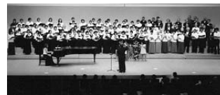
昨年の全体合唱の様子

♪那須塩原市・大田原市を中心として活動している合唱グループ10団体が出演。今回は各団体の演奏に加え、合同演奏も行います。