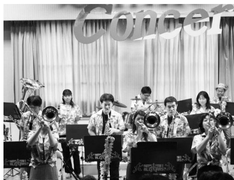
なみなみオールスターズ