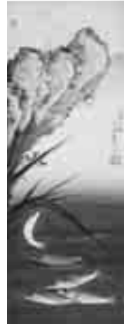
小泉 斐《鮎図》 栃木県立美術館寄託

後期では、郷土にゆかりのある画家の作品を紹介します。黒羽と関わりの深い小泉斐は、鮎の絵で有名ですが、当代一流の画家にも影響を与えたと思われる画家です。今回は、涼やかな《鮎図》・たおやかな《唐美人図》などを展示します。また、斐の師である島崎雲圃の《鮎図》や《唐美人図》なども展示します。鮎は、私たちにとても身近な生き物です。近世(江戸時代)の画家がどのように鮎を観てどのように描いたか、ぜひその一端をご覧ください。