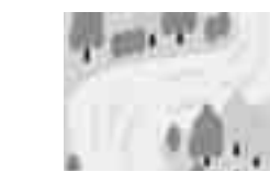
①河川などの水源から取り入れた水(原水)のチェック

・水道水の安全性を確保するため、取水している水の異常な濁りや有害物質の混入などの水質異常をいち早く検知するために、二十四時間体制で監視しています。 ・河川の水や地下水の水質検査を定期的に行い、水源状況に大きな変化がないか調べています。