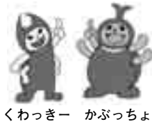
くわっきー かぶっちょ

オトシブミのメスは、大きな葉をクルクルと巻いて、その中に卵を一つ産みます。卵からかえった幼虫は巻かれた葉を食べて成長します。葉で巻かれた“ゆりかご”は、子供の身を守るとともに食物も提供する、愛情を込めた母親からの贈り物なのです。