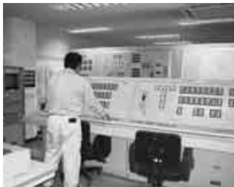
鳥野目浄水場における水質監視の様子

主な検査項目については、六ページの表のとおりです。市水道部窓口あるいはホームページで、水質検査計画や詳細な検査結果を公開していますので、見てください。