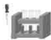
②浄水場でのチェック

・水道水の安全性を確保するため、取水している水の異常な濁りや有害物質の混入などの水質異常をいち早く検知するために、二十四時間体制で監視しています。 ・河川の水や地下水の水質検査を定期的に行い、水源状況に大きな変化がないか調べています。