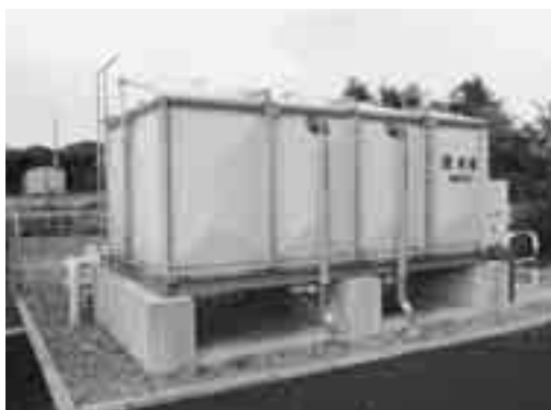
アパートの受水槽

これらは所有者が管理することになっていきますが、管理が不十分の場合、内部に雨水や汚水が流入したり、サビや藻などが発生し、水質が汚染されるおそれがあります。受水槽などは、清潔・適正に管理してください。