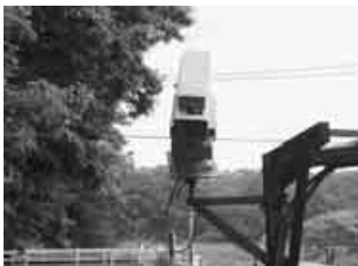
取水施設の監視装置