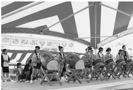
関谷子ども囃子の演奏

「さなぶり」とは、豊作を願い田植えの労をねぎらう目的で行われている行事で、毎年田植えが一段落した五月下旬に行われます。この日も地元商店街による模擬店や、お囃子や民謡の演奏、田植えに関連したミニゲームなどが行われ、訪れた人たちを楽しませていました。