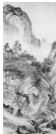
高久靄厓 《松巖書屋図》 栃木県立美術館蔵