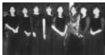
ヴォーカルアンサンブルAya Concerto

♪那須野が原で活躍するアーティストたちが出演。思う存分モーツァルトを満喫できます。