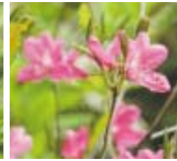
▲市の花「やしおつつじ」