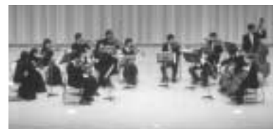
モーツァルト合奏団

出演 ヴォーカルアンサンブルAya Concerto、 なでしこ、モーツァルト合奏団