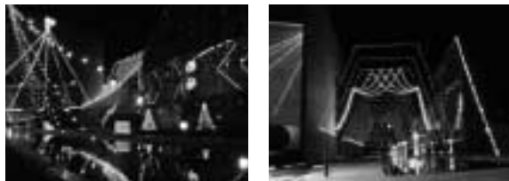
昨年のイルミネーション風景

毎年好評のハーモニーホールを飾るイルミネーション。今年“愛が奏でるプロムナード”と題して、5万球の色とりどりのイルミネーションが幻想の世界に誘います。どうぞ期待してください。