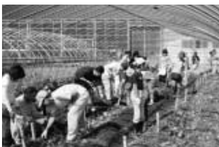
▲たくさん採れるかな？いも掘り体験