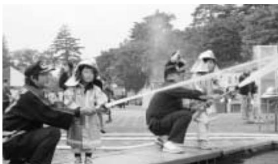
▲「ねえ、ぼくかっこいいでしょ？」 〈ちびっ子消防体験〉