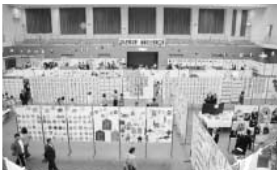
▲商工祭・教育祭会場