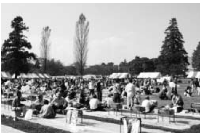
▲同時開催された畜産フェアも多くの人たちににぎわいました