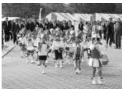
▲オープニングを飾った東保育園園児たちの鼓笛隊

商工祭・教育祭・芸術祭・福祉祭・健康祭・郷土芸能祭や畜産フェアなど多くのイベントが開催され、約35,000人の人たちににぎわいました。