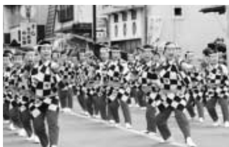
▲伝統芸能「梅后流江戸芸かつぽれ」