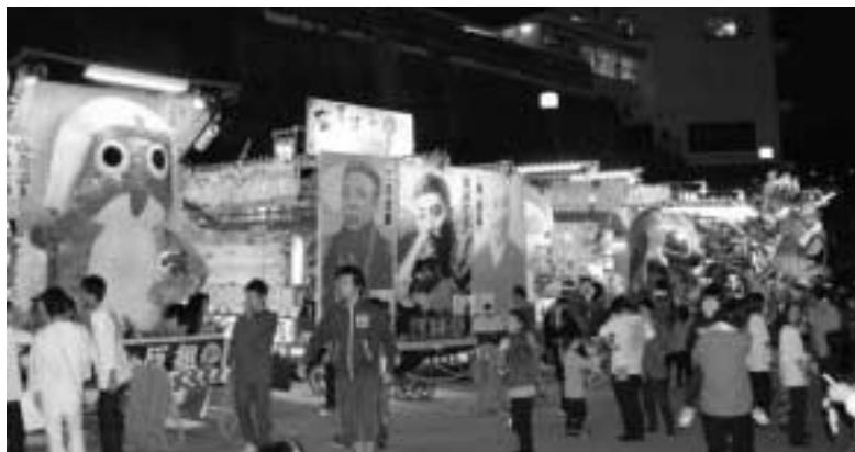
▲塩原温泉各地から集った工夫を凝らした山車