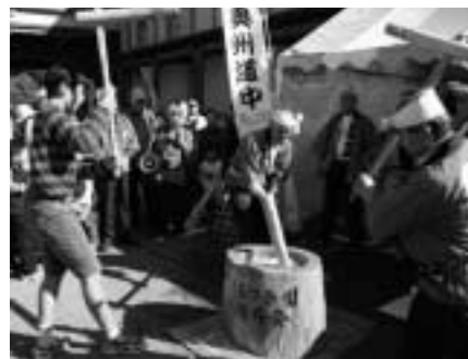
▲鍋掛もちつき唄保存会によるもちつき体験