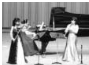
トリオ・ラ・プラージュ

曲目 ヴェルディ オペラ「アイダ」より凱旋行進曲、「サウンド・オブ・ミュージック」メドレー ほか ※おむね6歳以上向け。