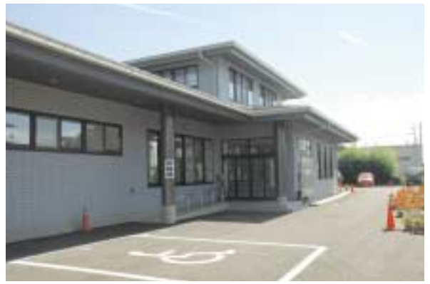
東那須野公民館外観