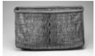
勝城蒼鳳作 証割千筋漆花籃「蟬時雨」

今回の展覧会では、東京国立近代美術館や京都国立近代美術館などから各作家の代表作を借用して展示、後期は42点のうち17作品を新たに入れ替えて展示しています。日本では20年ぶりとなる非常に見ごたえのある展覧会ですので、この機会に日本の竹工芸を堪能してください。