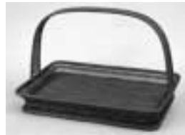
飯塚小珣斎作 竹刺編菱文提盤

■特別展「竹の創造—近代竹工芸の系譜と那須—」後期開幕 11月12日(日)まで <11月3日(金)～5日(日)は観覧無料>