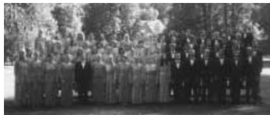
ヴェルニゲローデ合唱団