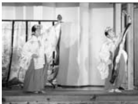
▲古式湯まつり 巫女舞の奉納