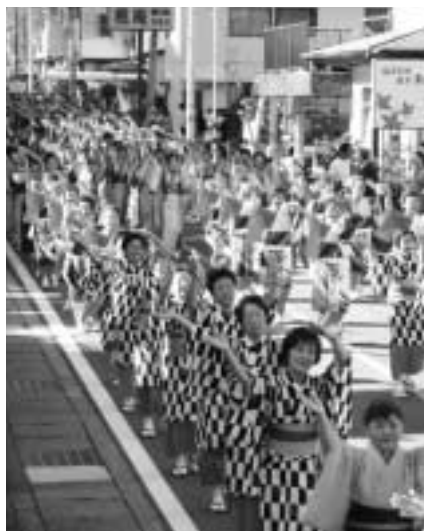
▲総勢300人による 流しおどり