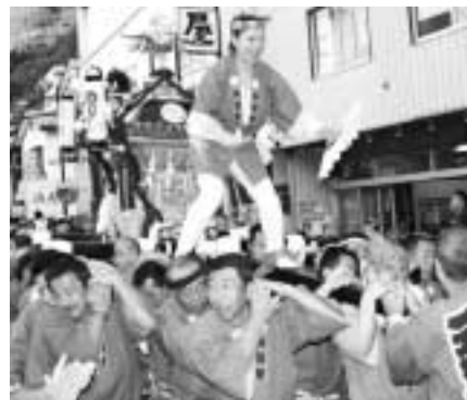
▲街中を神輿が練り歩き イベントを盛り上げました