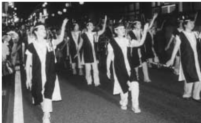
「流し踊り」でふれあい大賞を受賞した『西三島区』