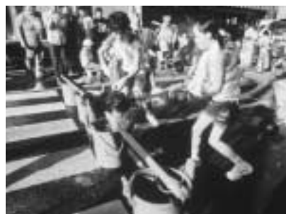
三人一組で石運び、丸太引き、水汲みを行う「疏水レース」

前日の28日(金)、には東小学校体育館で前夜祭の映画会が開かれ、2日間で約42,000人のみなさんがまつりを楽しみました。