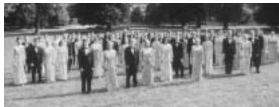
ヴェルニゲローデ合唱団