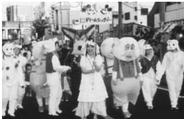
「仮装大会」グランプリの『ドリーム・ファンタジー』