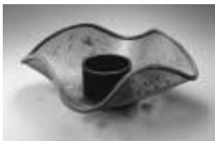
八木澤啓造作 透編花籃「竹時雨」