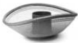
柳下昌峰作 花籃「秋風」