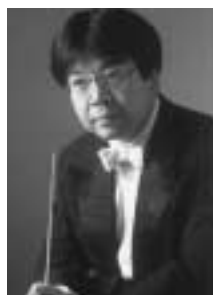
指揮 高関 健

指揮 高関健(群馬交響楽団音楽監督) 独唱 ソプラノ:増田のり子 メゾ・ソプラノ:大林智子 テノール:小貫岩夫 バリトン:青山貴 管弦楽 東京都交響楽団 合唱 ハーモニーホール合唱団ほか県内の合唱団 曲目 ベートーヴェン エグモント序曲 ベートーヴェン 交響曲第9番二短調『合唱』