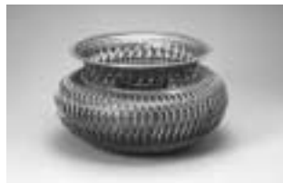
藤沼昇作 束編花籃「夢」

那須地域は良質な竹に恵まれ、竹細工が盛んに行われました。カゴ・ザルといった生活雑器としての竹製品製作の素地の基に、現在の「那須の竹工芸」が存在し、裾野を広げています。