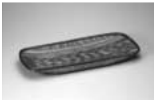
勝城蒼鳳作 証割千筋流線文盛籠「籠」