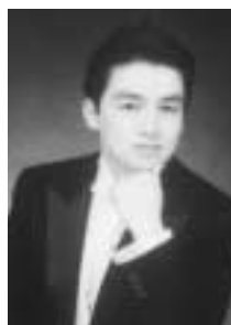
テノール 小貫岩夫