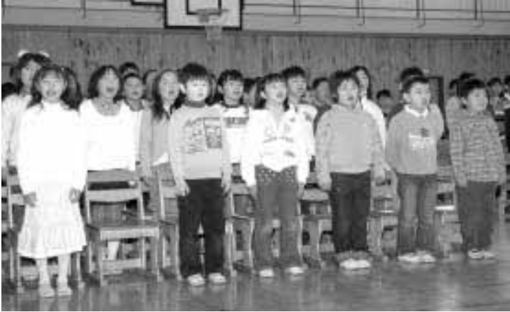
元気に校歌を歌う児童

”新生”塩原小学校の校歌と校章が決定し、3月17日に行われた、卒業式において、校歌（作詞）・校章の一般公募で入賞されたみなさんの表彰式が行われました。卒業式では、新しい校章を胸に、新しい校歌を歌う児童たちの元気な歌声が体育館に響いていました。