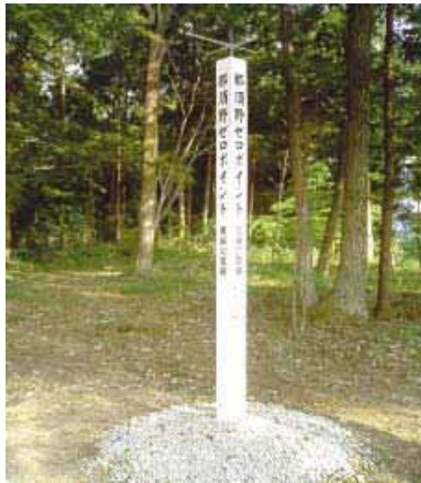
昨年8月21日、「那須野ゼロポイント」の標柱を建立

日本国内の陸地上のゼロポイントは39カ所あり、関東地方には3箇所しかありません。一つが埼玉県の秩父32番札所付近の崖に、もう一つが茨城県つくばみらい市（旧谷和原村）の田んぼの中に、あと一つが市内青木地内の雑木林にあり、全地球測位システム(GPS)を使って「ゼロポイント」が確認されました。