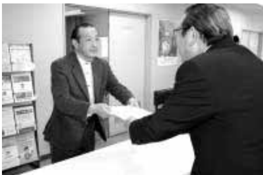
建築指導課窓口で第一号の建築確認申請書を受け取る栗川市長（右）

4月3日(月)には市役所建築指導課で、特定行政庁設置セミナーが行われ、栗川市長が市内の建築設計業者から、第一号の建築確認申請書を受け取りました。