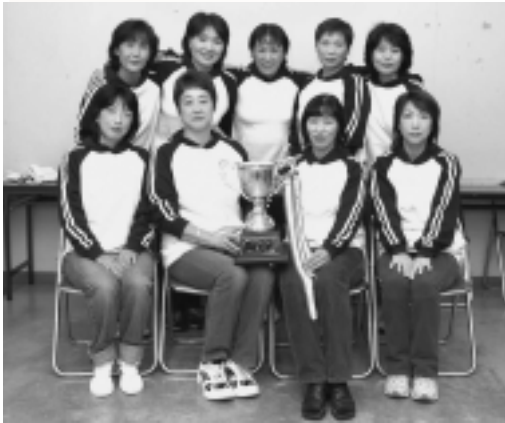
自慢は「チームワーク」 インディアカ関東大会で優勝