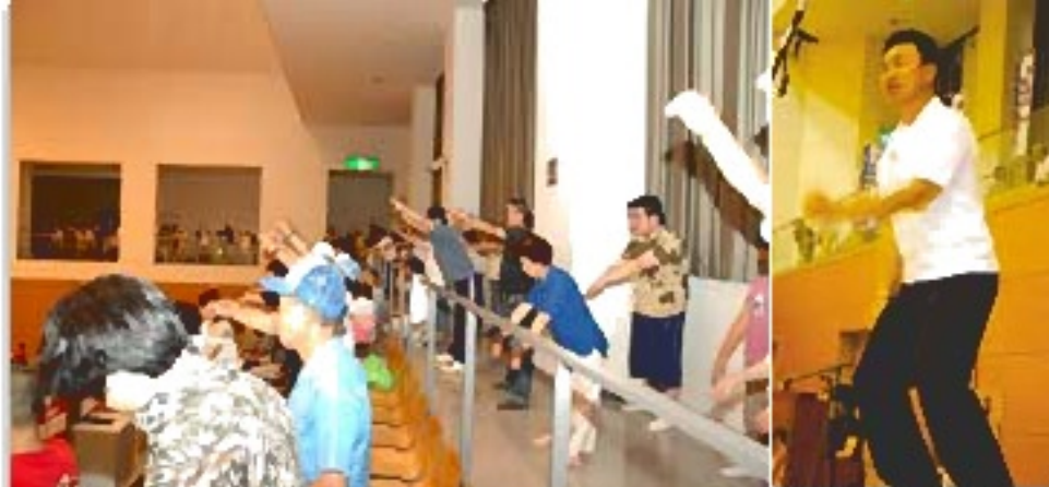
体育館でもいっしょに体操