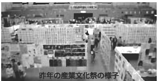
昨年の産業文化祭の様子

産業文化祭実行委員会事務局 (西那須野支局教育課生涯学習係) ☎0287(37)5113