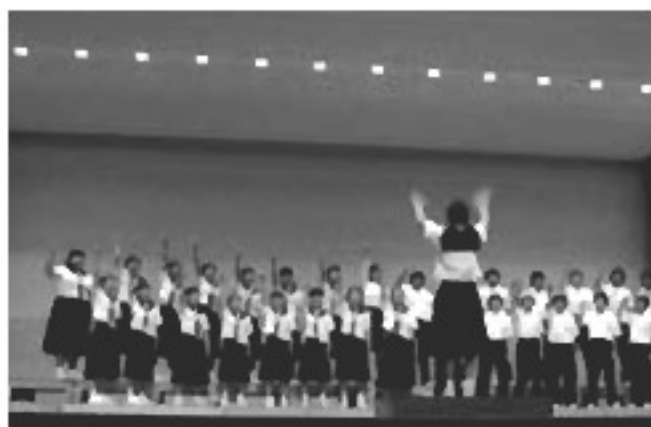
ミュージック課中では音楽クラスが練習の成果を披露