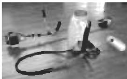
刈り払い機と噴霧機

自治宝くじの助成を受け、いなむらコミュニティ推進協議会、西那須野コミュニティ連絡協議会、関谷下田野地区コミュニティづくり推進協議会に多くの備品が配備されました。 これによりコミュニティの活動がますます活性化することが期待されます。 このように宝くじの益金は、私たちの身近なところで有効に活用されています。 詳しくは、生涯学習課 ☎0287(62)7194へ。