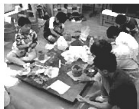
子どもも大人も一緒に楽しむ

7月2日(土)・9日(土)・16日(土)の3日間、須賀野が原博物館で、子ども土器づくり教室が開催され、小学生約20人が参加しました。