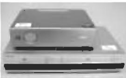
ビデオプロジェクター とDVD付ビデオ