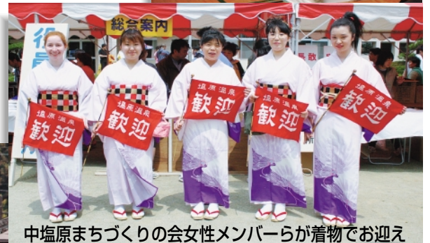
中塩原まちづくりの会女性メンバーらが着物でお迎え