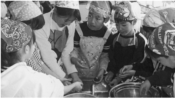
開こん記念祭でよもぎだんごを作る 槻沢小学校児童