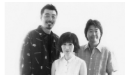
ソング・フォー・メモリーズ