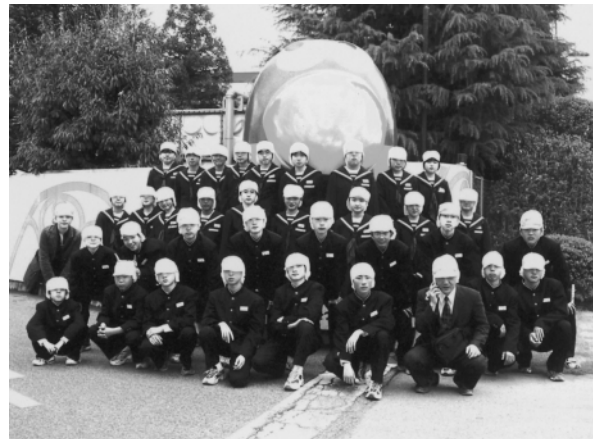
西那須野中学校2年生の遠足で小山の食品工場を見学

校に対して事業に係わる費用 を助成し、地域や児童・生徒 の実情に応じたより創造的な 学校経営を推進していきます。