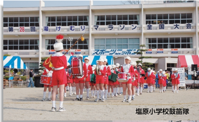
塩原小学校鼓笛隊