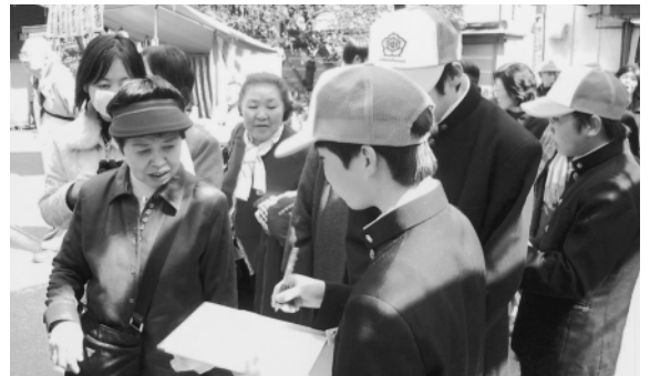
総合的な学習の時間に東京巣鴨で塩原のPRをする塩原中学校生徒

いが極端に減り、テレビなどの情報機器の影響が増し、家庭学習の時間が減ったことなどが指摘されています。