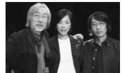
まるで六文銭のように