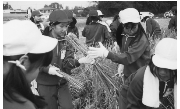
協力して稲刈りをする埼玉小学校児童