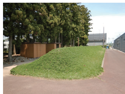
土手（復元）とヤウラ