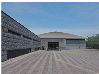
那須野が原博物館外観

また、歴史文化資源を後世に伝えるため、継続的な収集・整理・保存を進めていますが、収蔵スペースの不足により適切な保存が難しい状況にあることから、新収蔵棟の建設などの検討が必要です。