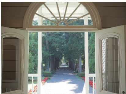
青木邸から望む杉並木