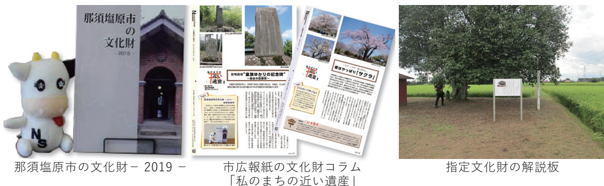
那須塩原市の文化財 - 2019 -

また指定文化財に関しては、現地に解説板を設置し、来訪者への情報提供を行っています。更に魅力が伝わりやすい手法の検討が必要です。