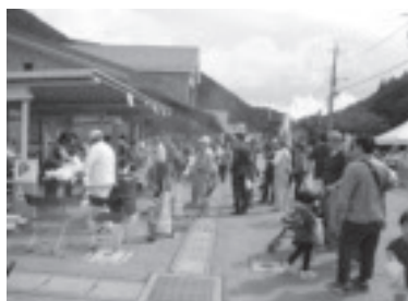
塩原温泉コミュニティまつり