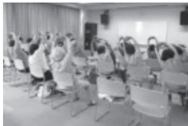
やしお大学(高齢者学級)