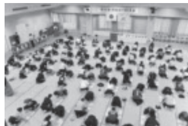
関東北かるた大会