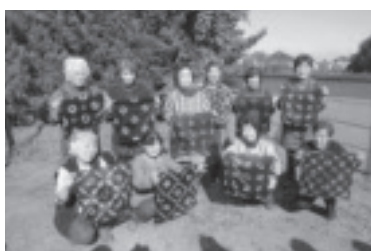
いなほ学級(高齢者学級)

各種講座事業を開催するとともに、地域のサークル・団体などの利用をさらに促進します。地域のコミュニティや学校などと連携し、相互補完しながら地域の特性を生かした諸施策を展開します。