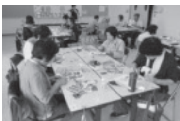
シニア倶楽部「しののめ」 切り絵

地域活動の拠点として、親しみのある公民館の環境づくりに努めるとともに、人づくり・地域づくりのために、より多くの学習機会を提供しています。コミュニティ、各種団体などの活動を支援し、自主活動の活性化を推進しています。グラウンドや多目的ホールを利用してスポーツが楽しめます。