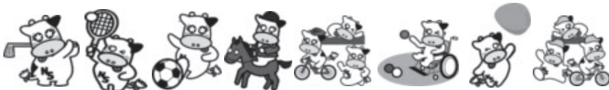
(写真は過去の大会の様子)

いちご一会とちぎ国体・とちぎ大会那須塩原市実行委員会では、市民の皆さんと一緒に大会を盛り上げるため、各種募集を開始しました。ぜひ、参加をお願いします。