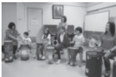
チャレンジキッズ(少年教室)