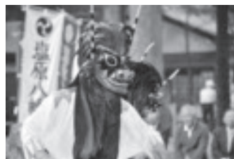
塩原平家獅子舞 (特別展「舞い踊る伝承」)