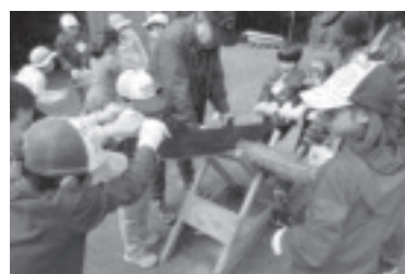
子ども体験塾(少年教室)