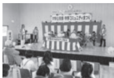
公民館まつり(おはやし)