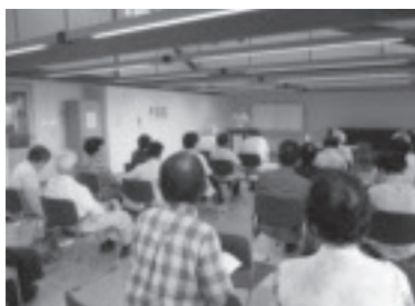
高齢者学級 とっこねえ

地域住民のコミュニティとして、だれでも気軽に利用、参加できる場・学級講座を提供します。乳幼児を持つ親の学習活動支援や在住外国人のための日本語教室を開催しています。