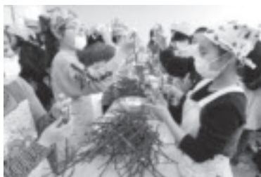
まゆ玉団子づくり

「文教と友愛の郷」をキャッチフレーズに、地域住民が気軽に参加できる学習の場の提供と地区コミュニティと連携したまちづくりを行っています。今年度は、小学生対象に少年体験教室とヒップホップダンス教室を開催し、仲間との協調性とコミュニケーションの大切さを学びます。コミュニティまつりは節目の30回目となります。