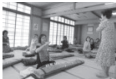
市民大学 お箏教室