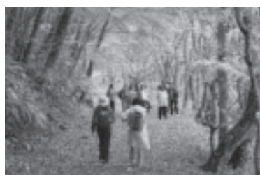
ふれあいハイキング