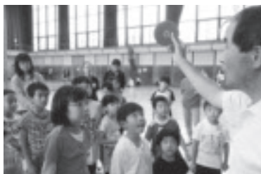
子ども体験クラブ～ディスコン～

乳児から高齢者まで幅広い年代の108団体が、公民館を利用しています。その利用者が、公民館主催事業の講師となり地域に多様な学びの場を提供しています。20人の公民館運営協力委員が、住民とのパイプ役となってスポーツイベントや公民館まつりを主体的に開催しています。