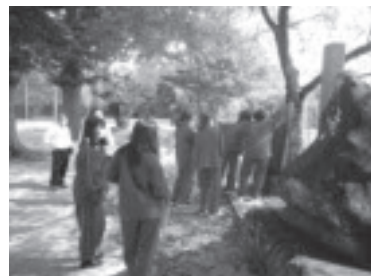
地元友だちプロジェクト