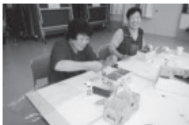
さわやか学級(高齢者学級)

豊かで明るい地域社会づくりのために、地区コミュニティ活動の支援や郷土芸能の伝承者の育成・活動支援を行っています。また、自主グループの育成・活動支援も行っています。