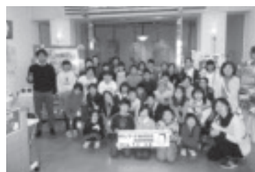
わんぱく少年団・おはやしクラブ 合同移動教室