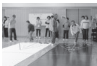
やしお学級(成人学級)