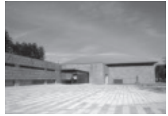
那須野が原博物館 ホームページ

「那須野が原の開拓と自然・文化のいとなみ」をテーマとした博物館です。特別展・企画展の開催と教室・講座事業にも力を入れています。地域に根ざし、市民とともに歩む博物館でありたいと願っています。また、附属施設として、江戸時代の中流農家の建物を移築した黒磯郷土館があり、当時の生活を再現しています。