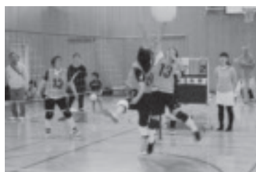
さいかつぼーる大会