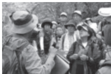
健康ハイキング～平成の森～