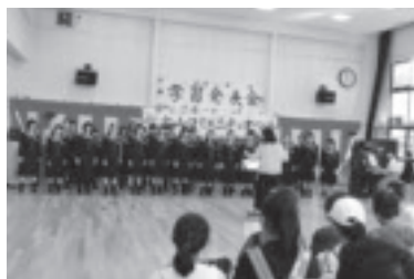
コミュニティまつり