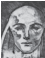
舟越桂 《戦争を視るスフィンクス》 (企画展「版画のゆくえ」)