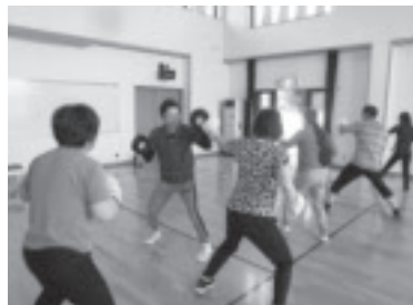
成人セミナー(ボクササイズ)