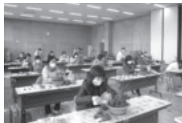
なでしこ学級(女性学級) 寄せ植え