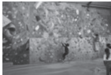
わんぱくチャレンジ塾(少年教室)