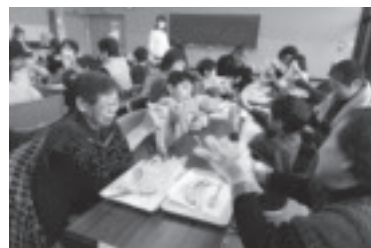
ときわ学級とさきたま保育園の交流会