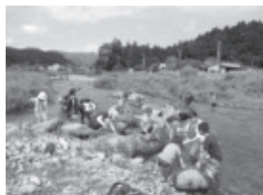
親子カジカ釣り教室