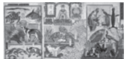
河鍋暁斎《今昔珍物集》 (企画展「ミュージアム×ミュージアム」)