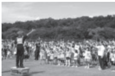
お楽しみレクリエーション大会

黒磯公民館（いきいきふれあいセンター）は、市民のみなさんの生涯学習活動の拠点として、各種サークル活動等を通し、生きがづくりや人との交流を目的とした施設です。百人一首かるた教室や関東北かるた大会など、百人一首かるたに関係する事業が特徴です。