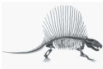
ディモトドン(栃木県立博物館蔵) (企画展「あつめてくらべる 化石図鑑」)