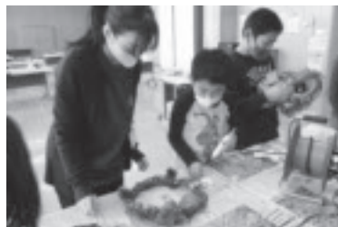
ワンパク大学 クリスマスリース作り