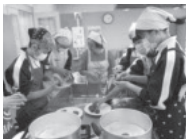
三中高齢者交流事業 炭酸まんじゅう作り