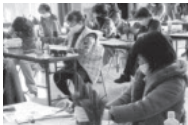
ミニ門松作り教室