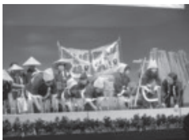
こどもおはやし会 田んぼの学校収穫祭