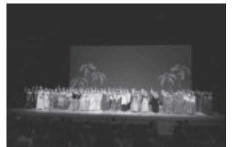
第10回フラフェスティバル