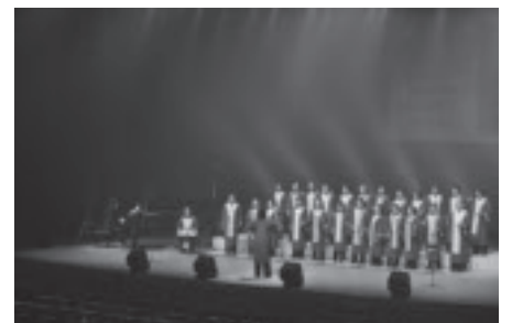
クリスマスゴスペルライブ