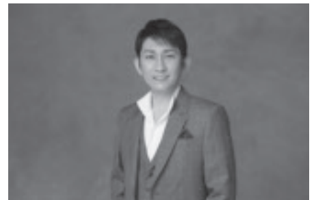
福田こうへいコンサートツアー 2020