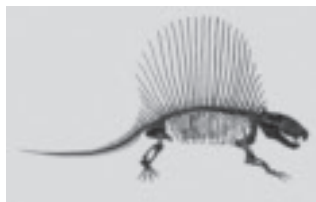
ディトロドン（栃木県立博物館蔵） （企画展「あつめてくらべる 化石図鑑」）