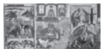
河鍋暁斎《今昔珍物集》 （企画展「ミュージアム×ミュージアム—博物館ってなにをするところ?—」）