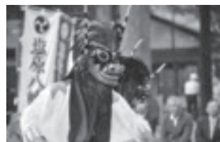
塩原平家獅子舞 （特別展「舞い踊る伝承」）