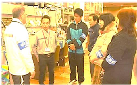
少年指導員の巡回風景