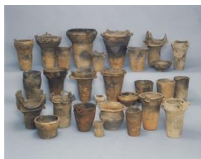
槻沢遺跡出土土器

三島農場は、薩摩藩出身で栃木県令も務めた三島通庸を実質的な代表とする「肇耕社」が明治13年(1880)に設立され、明治19年(1886)に三島個人の所有となり漸次拡大していきました。現在の那須野が原博物館は、この三島農場の事務所敷地に立地しています。博物館には近代の開拓に関わる資料が集積されており、展示などを通して活用されています。開拓に関わる近代遺産として、三島通庸を祀る三島神社などが残ります。