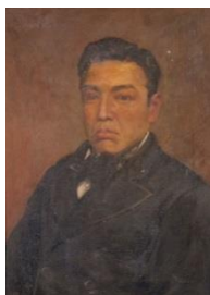
三島通庸の肖像画