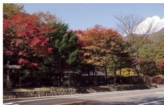
塩原軌道「塩原口」駅舎跡