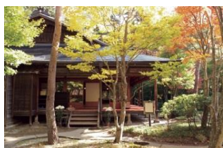
旧塩原御用邸新御座所

指定無形民俗文化財には、足利市の堀込源太節の流れである上塩原源太踊りや、古代獅子舞、塩原平家獅子舞が保存伝承されています。