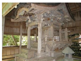
塩の湯温泉神社(本殿)