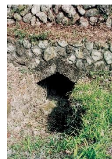
那須疏水 旧蛇尾川伏越出口