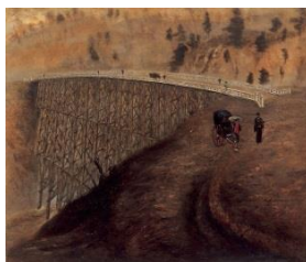
鑿道八景 第7景 下野塩谷郡男鹿川独橋有三架