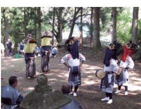
上塩原古代獅子舞