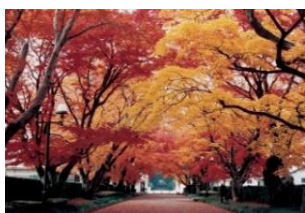
大山参道のモミジ並木