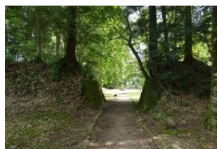
那須開墾社烏ヶ森農場跡 (土塁)