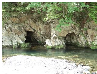
藁沼用水旧取水口