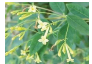
大山小学校のキガンピ