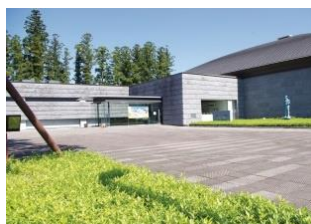
三島農場事務所跡 (那須野が原博物館)