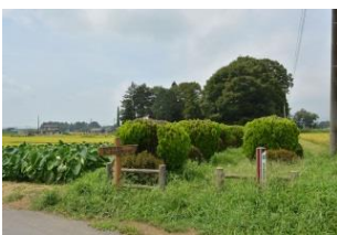
那須開墾社烏ヶ森農場跡