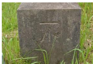
観象台の き 号水準点標石