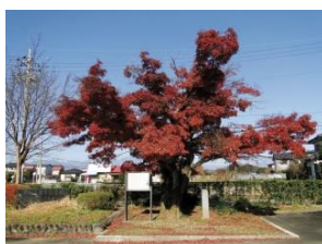
槻沢小学校の大モミジ