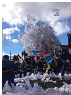
嶽山箒根神社梵天上げ

そのほか、藁沼から西那須野地区を経て大田原市に抜ける藁沼用水の旧取水口や、那須疏水の開削当時の施設の一部で、蛇尾川の地下を通すために設けた隧道である蛇尾川伏越など、水に関わる遺構も残ります。