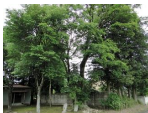
高柳温泉神社のエノキ