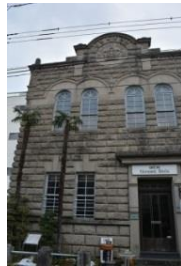
高木会館(黒磯銀行本店)