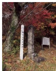
板室本村の湯本道標