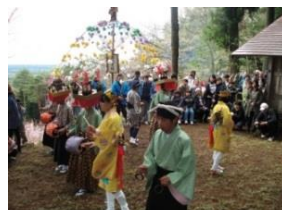
百村の百堂念仏舞