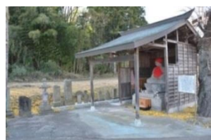
寺子地蔵尊と石塔類