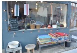
黒磯商店街店舗風景