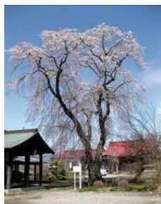
正観寺のシダレザクラ

旧奥州街道が余笹川に差し掛かる手前には寺子の地蔵尊が祀られています。この地蔵尊は信州高遠石工の作で、栃木県内では最古・最大のものといわれています。