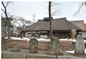
黒磯郷土館と 旧津久井家住宅

下厚崎村は那須野が原中部にあり、地下水が深く水利に乏しい場所でした。しかし、大仁田、小仁田とよばれる深さ2メートル足らずの浅い井戸2つがあり、地質の関係で干ばつの時でも水が涸れなかったと言われています。天正19年(1591)の『那須資景知行目録(那須文書)』には、「下あつさき」がみえ、近世は初め那須藩領でしたが、寛永20年(1643)から幕府領となりました。温泉神社と雷 ゆぜん 神社 なるかみ があります