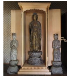
上黒磯の 木造阿弥陀如来立像