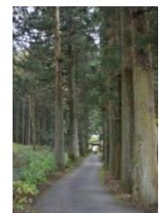
光徳寺門前の杉並木