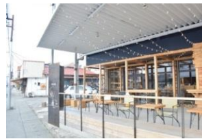
黒磯商店街店舗風景