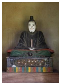
木造菅原道真座像