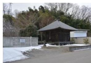
上黒磯の阿弥陀堂