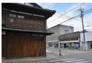
黒磯駅前商店街風景