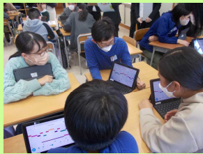
対話による学習 (大山小)