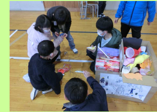
おもちゃ大会(東小)