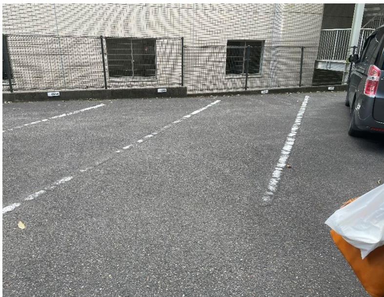
契約専用駐車場 (1部屋 1駐車場)