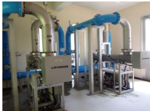
図 3.1 紫外線処理設備（中山配水場）

一部の地域の原水において、クリプトスポリジウムの指標菌である嫌気性芽胞菌や大腸菌が検出されています。指標菌は、水道原水に係るクリプトスポリジウムによる汚染のおそれの判断材料とされています。浄水場で処理された浄水においても同様に水質試験を実施していますが、嫌気性芽胞菌や大腸菌は検出されず、水質基準を満たしています。クリプトスポリジウムによる汚染が懸念される水源については、原水と浄水における水質試験の結果を引き続き注視していくとともに、水質検査の精度を向上させ信頼性を確保していく必要があります。なお、中山配水場では、原水のクリプトスポリジウム対策として、平成 24(2012)年 2 月から紫外線処理設備を導入しています。