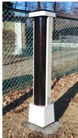
図 3.7 鳥野目浄水場第一水源沈砂池に設置された侵入検知センサー