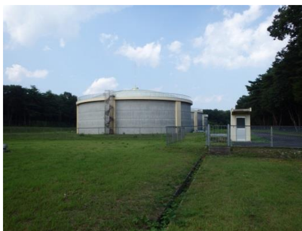
図 3.9 北那須水道折戸調整池