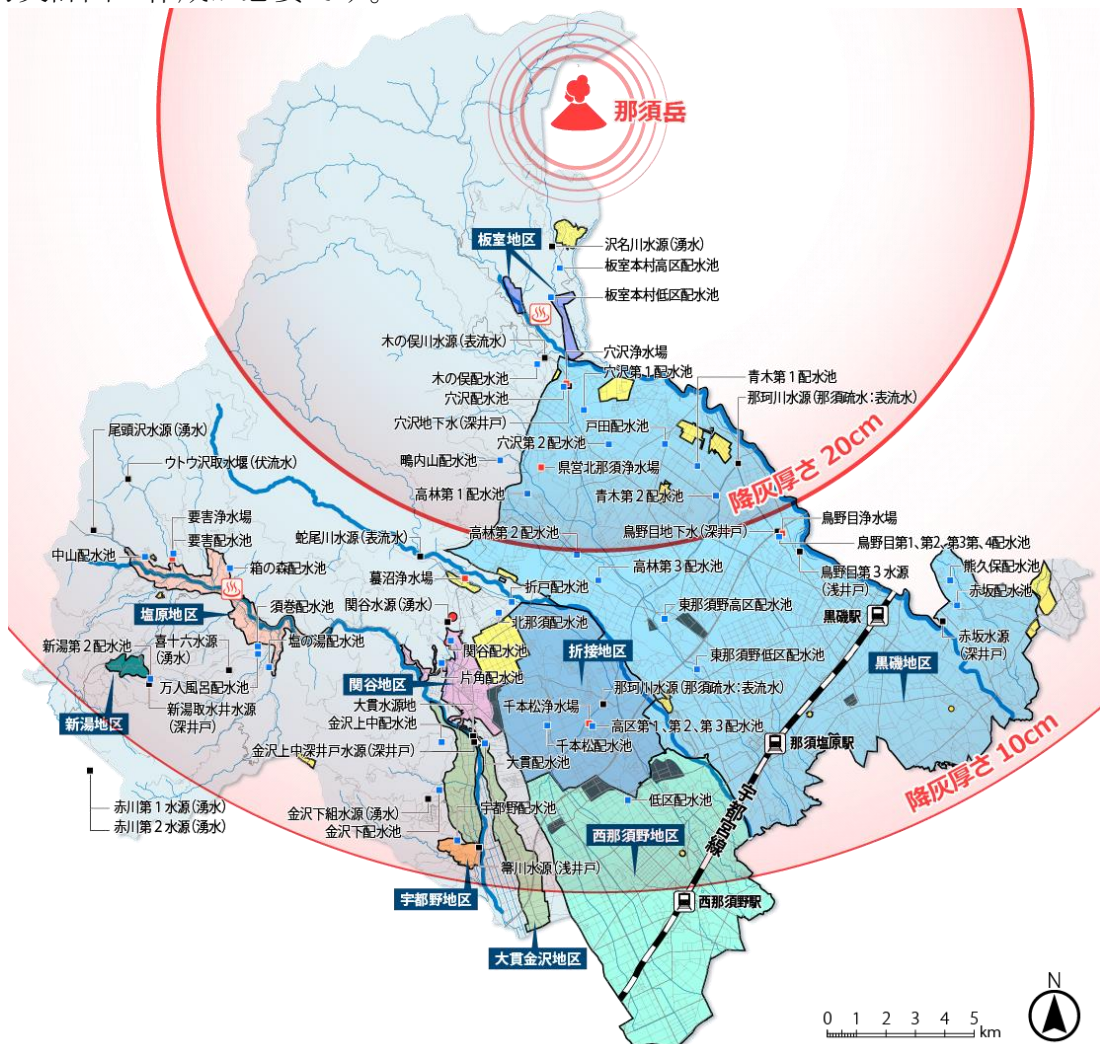
図 3.4 那須岳噴火時の降灰到達範囲（参照元：那須岳火山防災ハンドブック）

また、火山噴火時には、火山からの噴出物が河川を白濁化させ、濁度、色度及び臭気の上昇を伴うことが懸念されます。火山灰の河川水への混入に適切に対応するためには、凝集用薬品の確保や関係機関との連絡体制の強化及び火山災害における事前行動防災計画の作成が必要です。