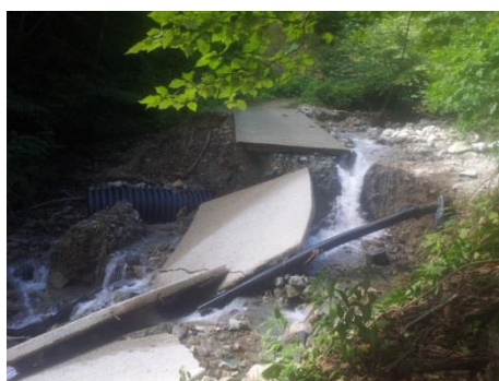
(導水管の被災状況)

また、給水用具の準備や個別給水などの課題にも、上下水道部のみならず市全体で取り組む必要があります。