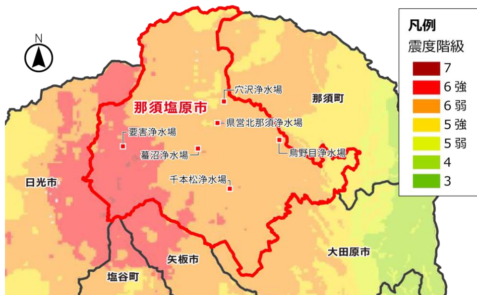
図 3.2 関谷断層地震時の震度分布図

東日本大震災では、水道施設も多大な被害を受けました。将来起こる可能性のある地震に耐えられるように、水道施設を強化していく必要があります。