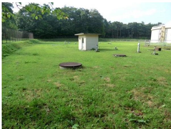
図 3.8 北那須配水池

水道の安全性を高め、施設の隅々まできめ細かな管理を行き届かせるためには、北那須水道を積極的に活用し、管理する施設を集約することも必要です。