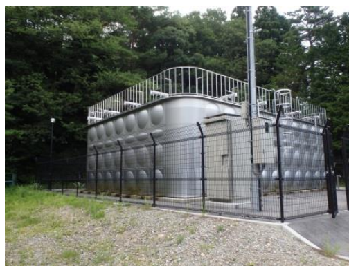
(板室本村低区配水池)