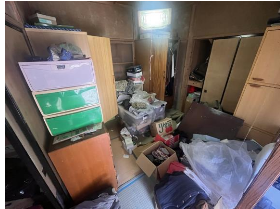
1 F 和 室