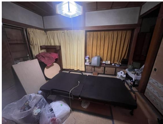
1 F 和 室