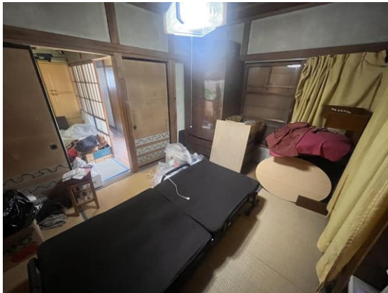
1 F 和 室