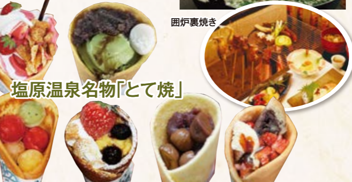
塩原温泉名物「とて焼」