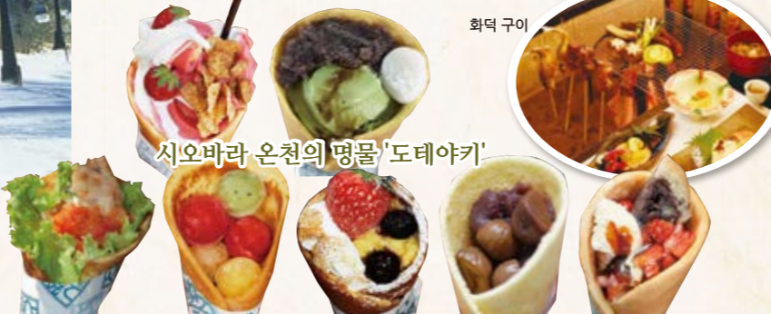
시오바라 온천의 명물 '도테야키'