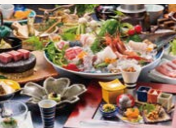
여관 저녁 식사 예