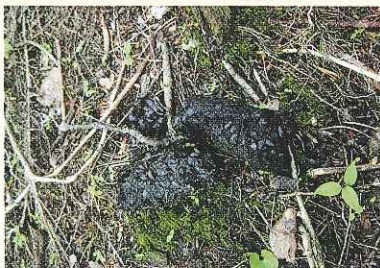
クマのフンや足跡を見つけたら、近くにクマがいるかもしれない。