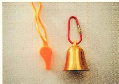
クマがいそうな場所や、やぶで見通しの悪い場所では、鈴やホイッスルを鳴らそう。